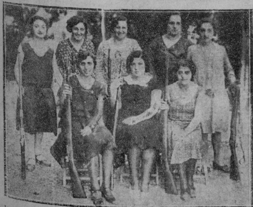
Interesante grupo de señoritas que han tomado parte en el concurso del Tiro Nacional, celebrado en San Sebastian.