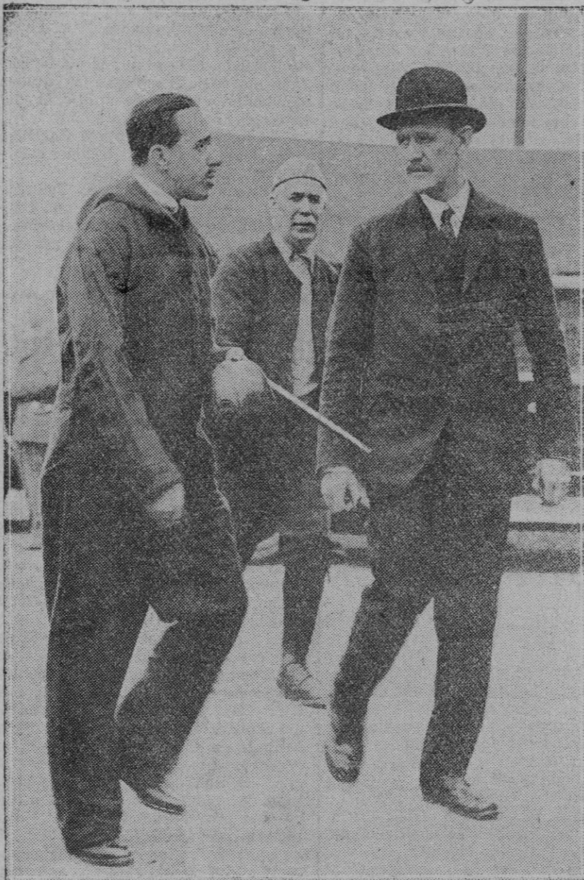
Su Majestad D. Alfonso XIII fué acogido por la población minera de Seaham Harbom entusiastamente. Después de almorzar con Lord Londonderry, descendió a una de las minas de que este es propietario. Nuestro Soberano se vistió para ello con un traje minero de trabajo. En la foto aparece en el momento de dirigirse al pozo de la misma.

Aunque otras razones no nos forzarán a ello, la razón de haber pretendido durante tantos años y con tan vivo interés la posesión de dicha construcción para derribarla, y la obligada correspondencia a la atención que con nosotros tuvo el Gobierno resolviendo pronto y satisfactoriamente la petición que Palma le había formulado, deben obligar al Ayuntamiento a dar principio a unas obras a las cuales viene obligado por otra parte en virtud de las cláusulas de la escritura de cesión.