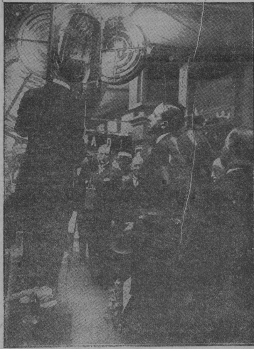
BARCELONA.—Su Majestad el Rey viendo la instalación y el funcionamiento de un faro, en su visita al pabellón de Suecia, de la Exposición Internacional.

Vaya por ello nuestro aplauso más entusiasta a la Compañía de Tranvías Eléctricos, cuya gestión nos place no solo aplaudir sino alentar, a fin de que prosiga su meritoria labor, de la cual tantos y tan señalados beneficios ha obtenido y puede obtener Palma, motivo por el cual hemos de unir a la felicitación que dirigimos a la Com- pañía, la expresión de un vivo reco- nocimiento.