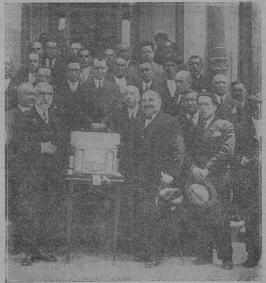
ZARAGOZA.—El alcalde y demás autoridades de la provincia en el homenaje tributado al gobernador civil general Cantón-Salazar por su acertada labor realizada durante dos años de mando en dicha provincia.

MI primer trabajo al llegar a Barcelona fué el de orientación, pregunté que médicos practicaban el sistema, me informé de su crédito profesional, de su solvencia científica. Visité el