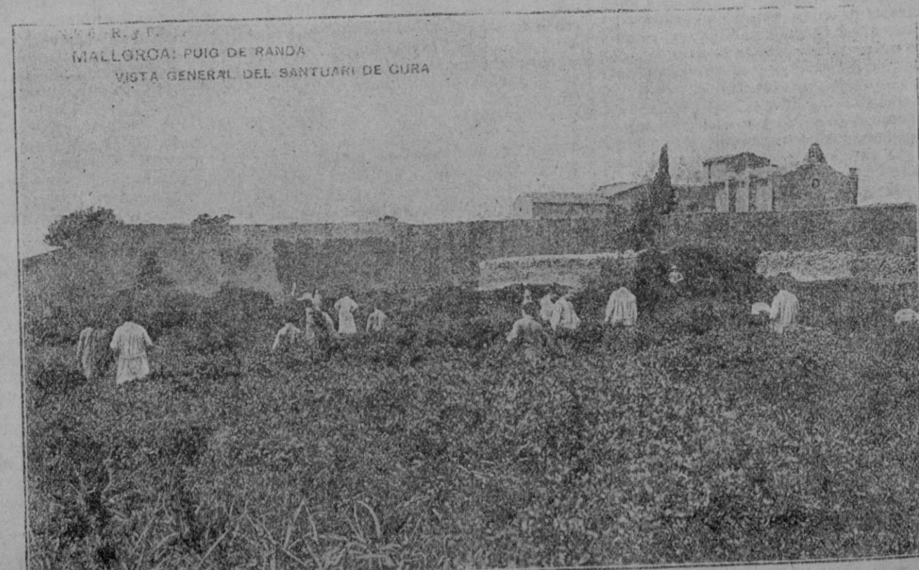
Vista general del Santuario de Nuestra Señora de Cura.

La citada excursión fué llevada a cabo en el menor contratiempo, regresando los excursionistas, todos y alegres, cerca de las doce de sus respectivos hogares.