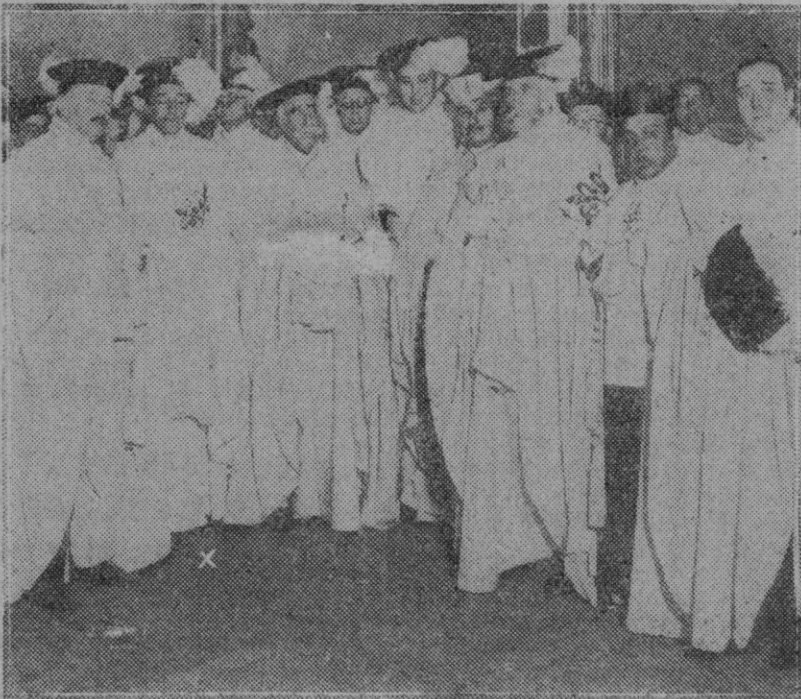
MADRID.—El Duque de Alba y Berwick en la Iglesia de las Calatravas en la ceremonia de tomar el hábito y armarse caballero de la Orden de Calatrava.

De este modo se destruyen falsas y perniciosas leyendas sin perjuicio de las inconfundibles características de la raza; convencidos de que la prosperidad y el porvenir de los pueblos dependen en gran parte de su influencia espiritual en el mundo.