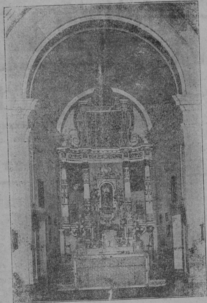
Altar Mayor de la nueva Iglesia de Cura con la Imagen de la Virgen Santísima en el centro.