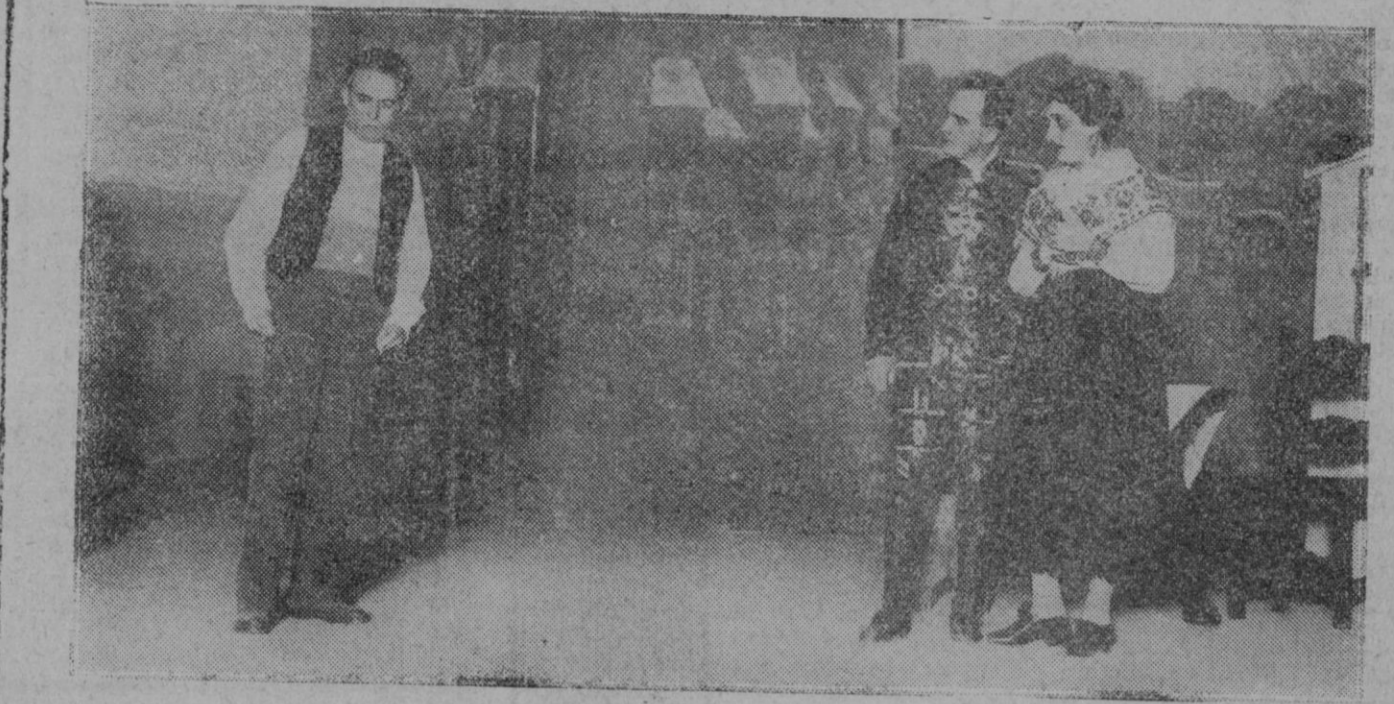
MADRID.—Una escena del drama de Eduardo Marquina, «Sin hora ni cuchillo», que ha sido estrenado con gran éxito en el Teatro Español.

El motor es de tipo Vickers-Napier de mil caballos de fuerza, iguales a los que usan los aeroplanos de bom-