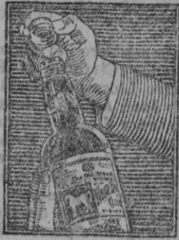
¡Se destapa tan fácilmente!

Es la marca más antigua de Escocia y se distingue por su madurez, suavidad y exquisito paladar; hasta la última gota está madurada en cascos de madera.