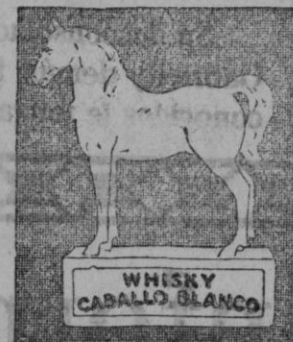
El Whisky «Caballo Blanco»