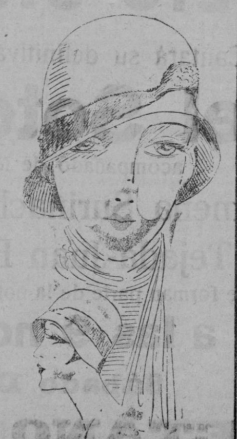
SOMBRERO.—Fieltro beige guarnecido de jersey de avestruz beige anaranjado.]