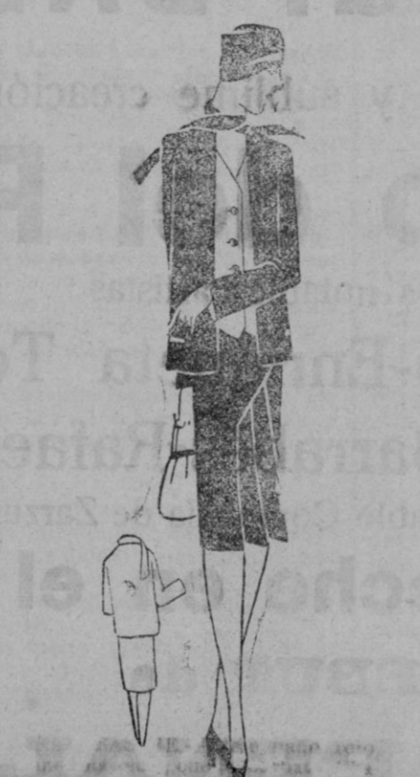
TRAJE SASTRE.—Traje paño rojo, chaqueta recta, cuello-corbata. Chaleco gris claro.