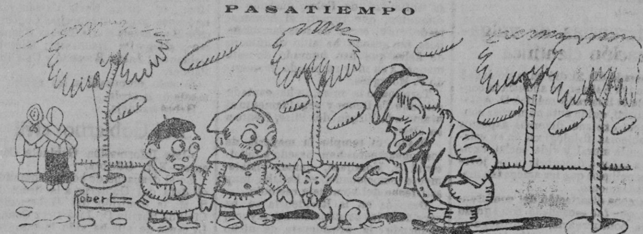
—¿Ves este perrito? Pues tiene cinco meses y ya anda, y tu hermanito, que tiene más de nueve, no. —¡Qué gracioso! El perrito tiene cuatro patas y mi hermanito solo tiene dos!

Acción teatro. Razón; Plaza Sar ta Eulalia, número 10.