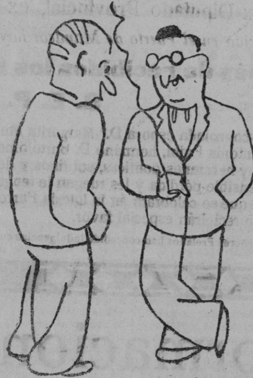
—Mira, chico, he decidido poner fin a mi vida, y vengo a pedirte tu revólver. —Buena; llévatele, pero no dejes de traerme después.

almacenes os obsequian, habrá seguido la desilusión de que el «aerostato» a las pocas horas, perdía su prestancia y dejaba de mantenerse en el aire. Ocurra, senollamente, que se le ha escapado el gas.