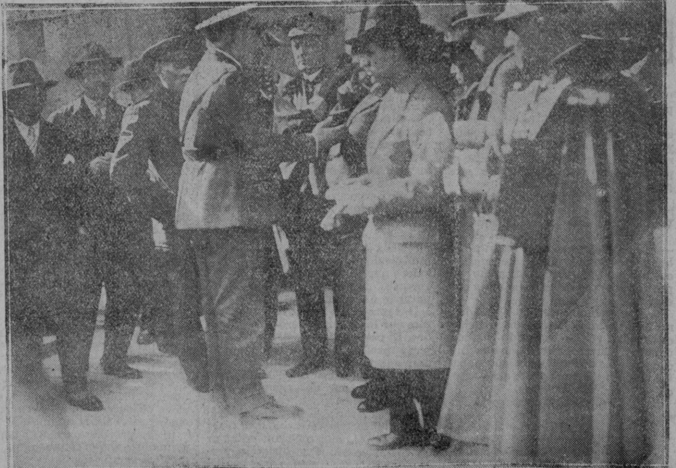
MACRID.—El Presidente del Gobierno, General Primo de Rivera, saliendo de Palacio después de celebrado el Consejo en que quedó firmado el Decreto por el cual todos los jefes y oficiales de la reserva activa del Arma Artillería se considerarán provisionalmente pasenens.

Y que ocupación! El Alto Comisario francés, M. Tirard se aloja en el Palacio de la Presidencia, disponiendo de unas 58 habitaciones; decimos disponiendo sólo teóricamente, puesto que M. Tirard está casi siempre en París; hace un viaje de París a Coblenza una vez por semana; los viernes; firma los papeles que le ponen sobre la mesa y deja a funciones permanentes a su secretario