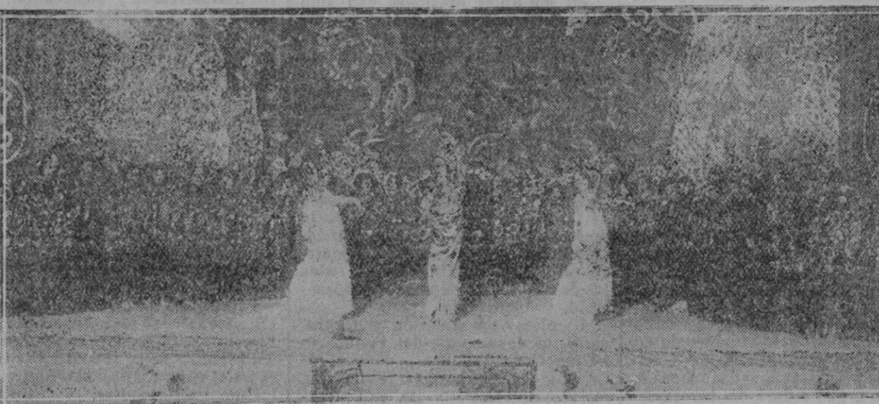
MADRID.—Una escena de la zarzuela «El mantón español» que ha sido estrenada en el Teatro Price.

estar muy cerca de la nuestra sabe a plática de familia, a cuento de abuela, a canción de infantes, y que los hombres de ahora hemos visto muchas veces perpetuada materialmente en una lámpara olvidada o en una porcelana del salón o en un fanal de la oscuridad de verano.