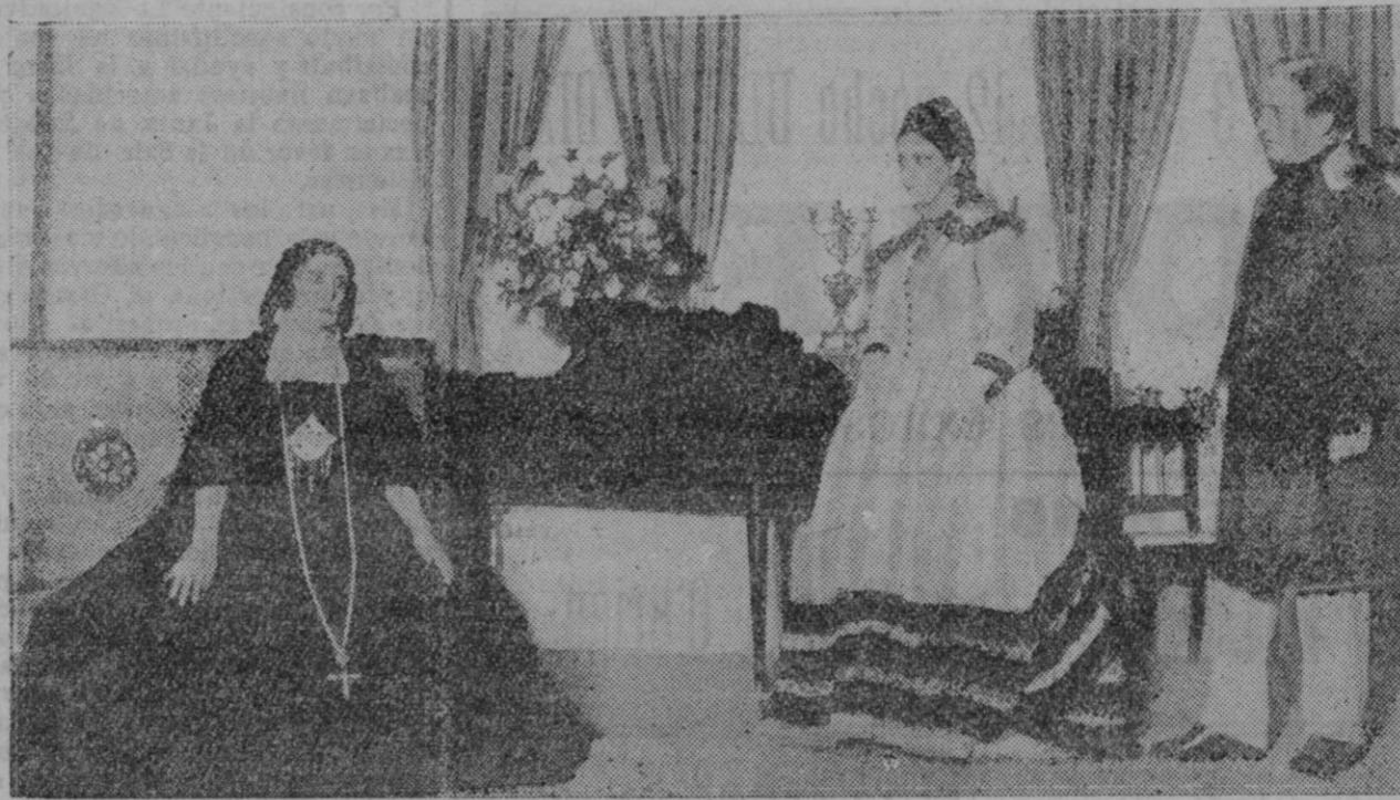
MADRID.—Una escena de la obra «Romance» que ha sido estrenada en el Teatro del Centro con gran éxito.

Hoy y mañana son los últimos días de proyección del programa que con tanto éxito se estrenó el jueves en este favorecido salón. La luz de la ventana , es una interesantísima comedia dramática que gusta mucho y la selección Gaumont Diamante Azul La Duquesa del Folies Bergere , interpretado por la monísima Mady Christians y André Roanne, divierte muchísimo al público que no deja de reír las muchas situaciones cómicas, que abundan en la obra. Ambas películas son muy aplaudidas en todas las sesiones. Hoy se proyectará por última vez el segundo rollo del Concurso de artistas empujados para el que se conceden, de verdad, importantes premios.