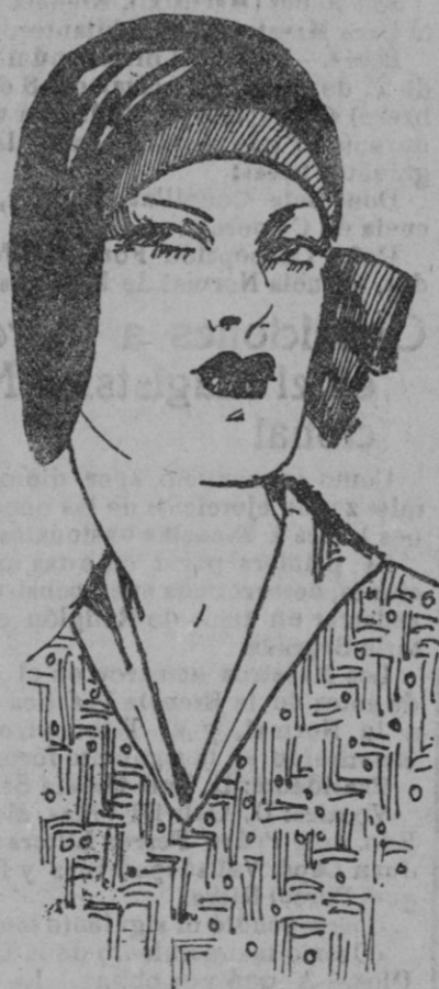
Sombrero de topé negro con ancha cinta de crepé roman gris perla.

hacían de tapadillo. Fumar, por ejemplo; en Europa no fumaban las mujeres en público; sólo cierta categoría de mujeres se atrevían a fumar desahogado al decoro. Pero este acontecimiento en Europa: tan pronto como llegaba uno al Nuevo Mundo, encontraba que las mujeres fumaban sendos cigarros puros. Eran, por ventura las subanas, las mejicanas, y otras y otras, menos virtuosas que las parisienses o las madrileñas? Nadie contestará afirmativamente. Sin contar con que ya haos cinuenta y más años, las bellas sevillanas fumaban sus cigarrillos perfumados.