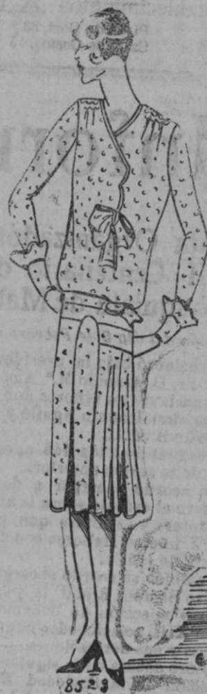
VESTIDO.—Para «Coquette», es un bello crepón rojo de lunares negros y blancos que está empleado por un arte consumado del corte.