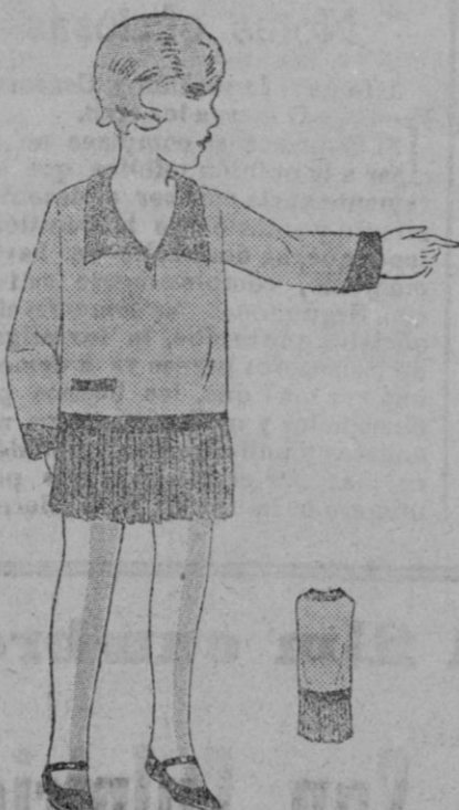
VESTIDO DE NIÑA.—Vestido ejumper, la falda de paño verde hilo está finamente plisada entre anchos pliegues redondos. El corpiño es de paño o franela blanca. Cuello claudina y bocamangas de paño o crespon de china.—Tela: 0'30 en 1'40.—Juniper: 0'40 en 1'40.

Figuran en este libro diez y ocho cartas de mujeres, dirigidas a hombres, y tres contestaciones de hombres. Ninguno de estos es Ovidio. Las cartas son fantásticas pues el autor las atribuye a Penelope, Briseis, Fedra, Dido, Hermiona, Ariana, las cuales dirigen sus epístolas a Ulises, Aquiles, Hipólito, Eneas, Orestes,