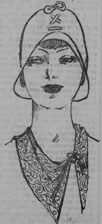
Bonito sombrero verde mar con cinta estrecha de terciopelo del mismo tono.