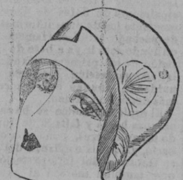
SOMBRERO.—Este fieltro verde almendra está adornado con cortinas «palettes» de «minoches».