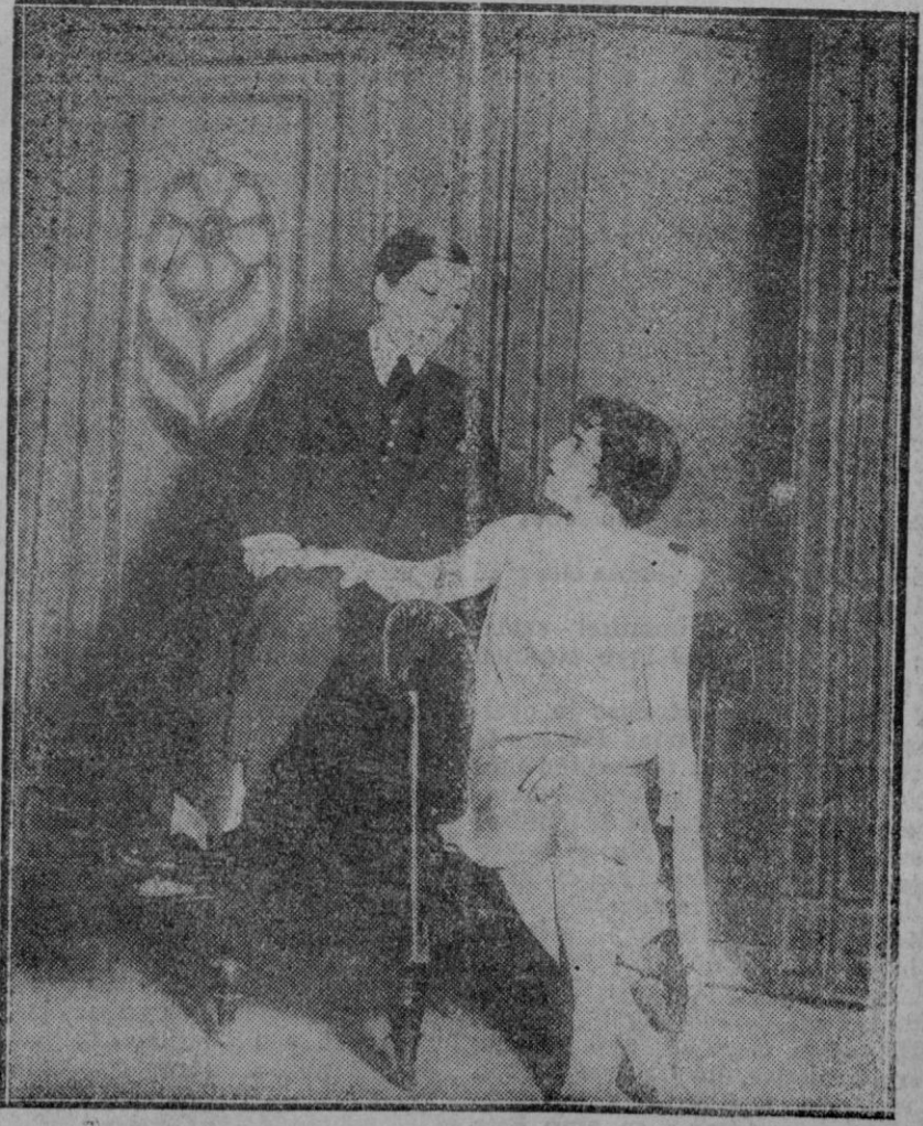
MADRID.—Una escena de la obra «A la izquierda la cabeza», que acaba de ser estrenada con gran éxito en el Teatro Esquiá.