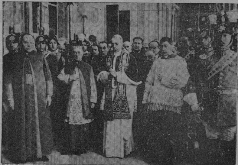
S. S. Pío XII, el día de su exaltación Pontificia

objetos de oro y plata, papeletas de empeño. — Vidriera, 27 entr.º de 10 a 1 y de 4 a 6.