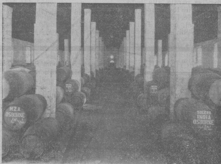
BODEGA DEL "COÑAC"

Y el puro Coquinero , de vinos el mejor.