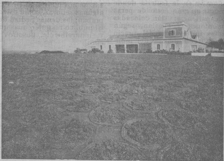
VIÑA "LA ATALAYA" Soleado de la uva