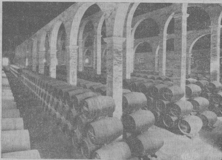
Bodega de SAN JOSÉ. «Bodega monumental», albergando en su recinto 25.000 botas de 500 litros cada una, de exquisitas y renombradas SOLERAS.

Alcemos esta copa que llena con su vida la sangre de las viñas de España. Labebida será de nuestro impulso magnífico crisol. El vino de la Patria, la esencia bendecida de cuanto es ansia y sueño brillante y español.