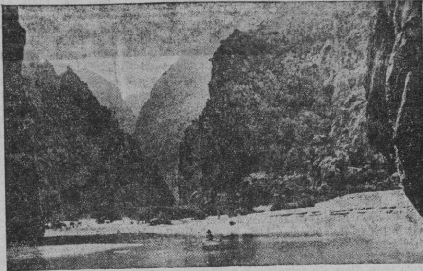
SOBERBIA DESEMBOCADURA DEL «TORRENT DE PAREIS»