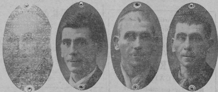
Antes y después del Tratamiento.

Al mes y medio de funcionar en Palma la clínica para la curación de la calvicie bajo el tratamiento J. MOURADE, ya se han obtenido numerosos éxitos sorprendentes en personas mallorquinas honorablemente conocidas, que están maravilladas al ver crecer su pelo que hacía más de 10 años habían perdido. El efecto del capilar, para la caída del pelo y lo devuelve con el color natural, destruye la caspa y todas las enfermedades del cuero cabelludo. Eficacia garantizada y completamente inofensiva.