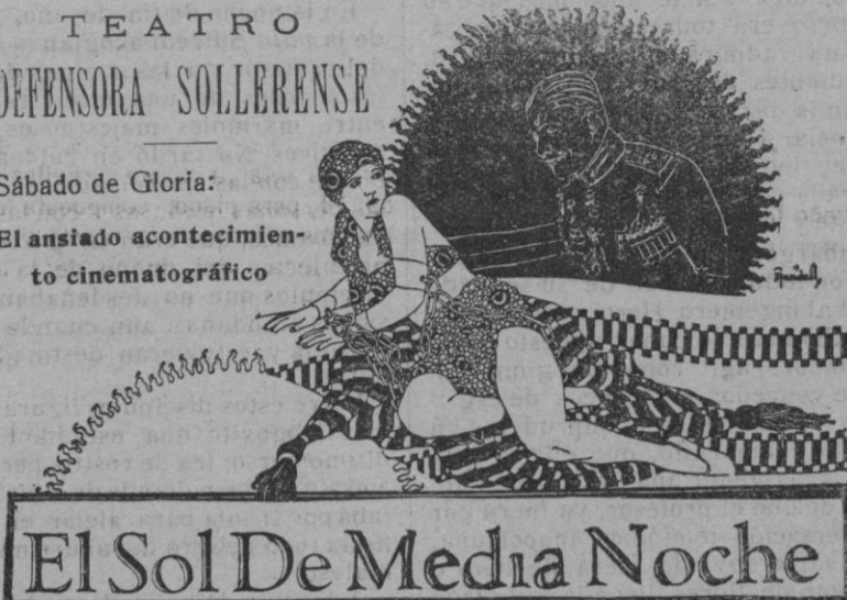
La película cumbre de 1927

El ansiado acontecimiento cinematográfico