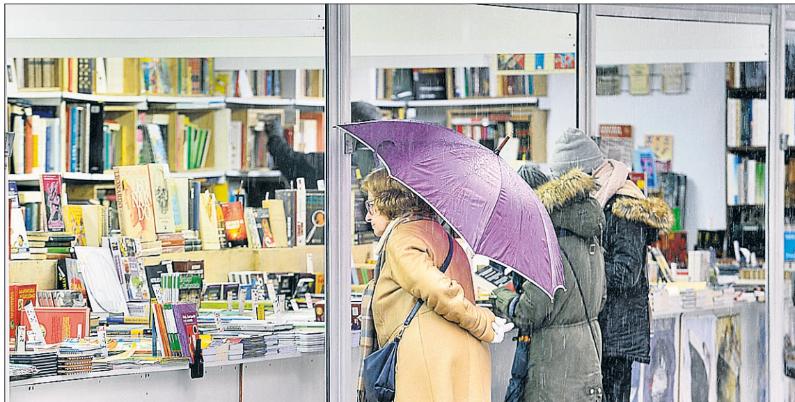
La lluvia no impidió a la gente acercarse a ver los puestos de las librerías. / KAMARERO

Numerosos libros de ocasión y de temáticas muy variadas ocuparon esta Feria que ha cumplido ya la friolera de 25 años, un cuarto de siglo instalándose año tras año, atrayendo a sus pequeños puestecillos a los segovianos y visitantes que se quisieran acercar a ver,