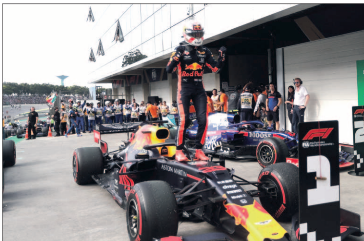
El holandés Max Verstappen de Red Bull celebra su victoria.

Una nueva carrera se abrió a invitados inesperados. Verstappen, Albon, Gasly, Hamilton,