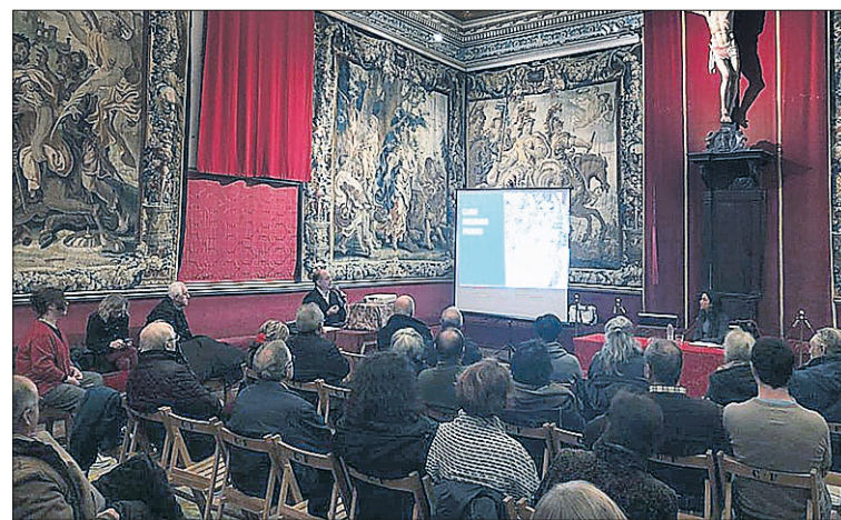
Un momento de la conferencia celebrada el pasado día 15.

Uno de los objetivos de los ponentes era que el público asistente comprendiera cómo