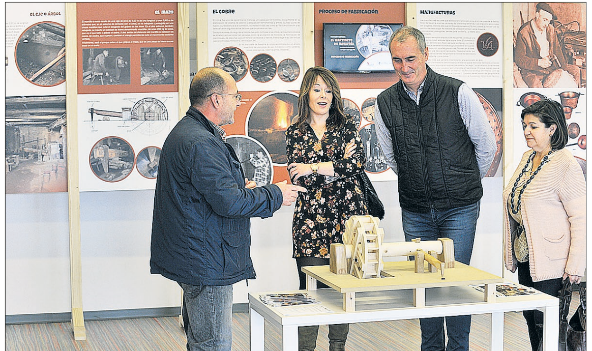
Las autoridades contemplan la maqueta del Martinete de Navafría. / KAMARERO

Se trata de un ejemplo de establecimiento preindustrial de tratado de cobre que representa la continuidad de un método artesano que se remonta a la tecnología de la Edad Media, e incluso a la Edad Antigua.