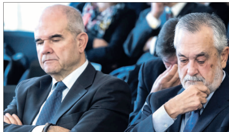
Manuel Chaves y José Antonio Griñán en una sesión de la vista oral.

Manuel Chaves pertenece al grupo de encausados a quienes los fiscales ‘sólo’ acusan de prevaricar, frente a los seis años de cárcel y 30 de inhabilitación que solicitan para su sucesor, José