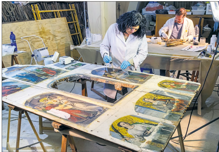
Los dos restauradores que han trabajado en el retablo de Frumales.

Junto con estos vídeos, las redes sociales completan la acción divulgativa de la Catedral con pu-