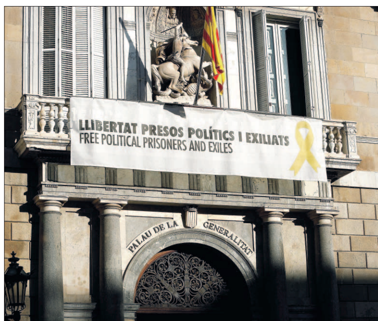
La pancarta y simbología en apoyo a los presos, causante del juicio.

La Fiscalía pide un año y ocho meses de inhabilitación para el presidente de la Generalitat para cualquier cargo público de ámbito local, autonómico, estatal o europeo y multa de 30.000 euros, una condena que Vox, acusación popular en la causa, eleva hasta los dos años de cárcel y