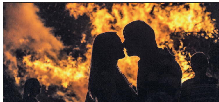
Los jóvenes españoles tienen su primera relación sexual a los 17 años.

A la pregunta de si se deseaba tener la primera relación sexual o fue un poco forzada, una de cada diez chicas dice que el entorno las empujó un poco a tenerla porque existen mitos como el de la