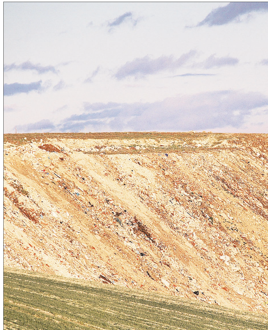
Estado de la escombrera de Cuéllar, que también será acondicionada.

Autorización. El Consorcio Provincial de Medio Ambiente está a la espera de recibir el informe favorable de la Junta de Castilla y León para comenzar las obras en 60 municipios