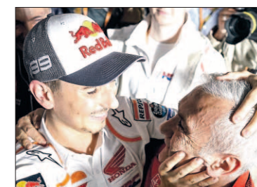
► JORGE LORENZO

Antes, cuando solo se habían disputado seis vueltas, el de Cervera había superado al 'poleman' del sábado, el francés Fabio Quartararo (Yamaha), solo unos giros después de bajar el récord