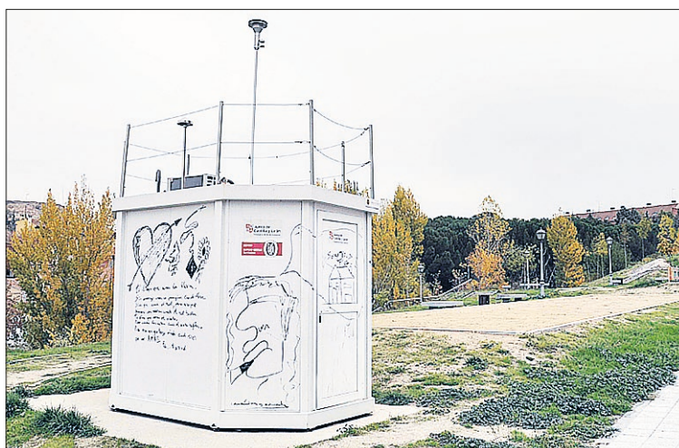
Estación medidora de la calidad del aire.

tamiento de escombros en el de Burgos (569.800 euros anuales), la de huertos de ocio de este mismo consistorio (7.700 euros), los ingresos por venta de energía eléctrica fotovoltaica del Ayuntamiento de Miranda de Ebro (2.190 euros), la venta de energía eléctrica por el de Béjar (610.858 euros) o los de la tasa de protección del medio ambiente en Valladolid (10.838 euros).