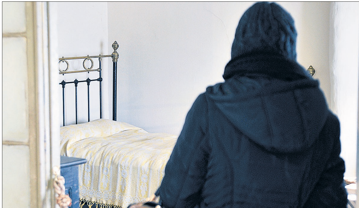
Una mujer observa la cama del poeta durante una visita a la Casa-Museo Antonio Machado.