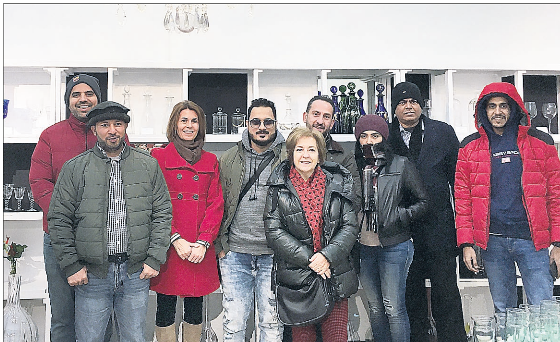
Los visitantes tuvieron la ocasión de visitar la Real fábrica de Cristales

Apoyado por la aerolínea Etihad Airways, que también ha enviado a un representante a este viaje de familiarización, y por la Oficina de Turismo española en Abu Dhabi, Prodestur ha querido trasladar a estos directivos de ventas los motivos por los cuales es preciso considerar incluir a Segovia como destino preferente en sus paquetes turísticos. La aerolínea saudí ha abierto recientemente una ruta desde