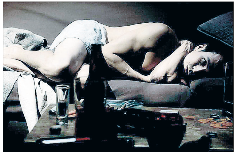
Fotograma de 'Día 6', que se proyecta hoy lunes en La Cárcel a las 20 horas.