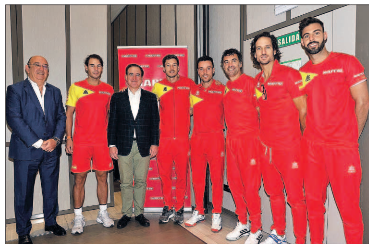
El equipo español posa antes del inicio de la Copa Davis.

"A Rafa le encuentro en una buena forma física, no tan contento como le gustaría, porque le habría gustado estar en las semifinales o en la final del Masters para haber jugado más, pero se siente bien y con un nivel bueno, está listo y muy motivado para jugar en Madrid y con el resto del equipo", expresó Sergi Bruguera a los medios en la Caja Mágica.