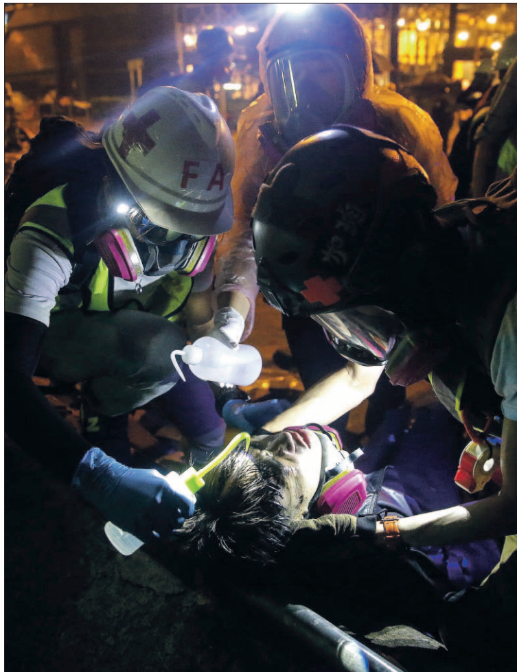
Un herido en las protestas recibe primeros auxilios en la universidad.

BARRICADAS Las barricadas provocaron un caos de tráfico generalizado en el centro financiero en los últimos días, por lo que grupos de voluntarios acudieron el sábado y el domingo a las cer-