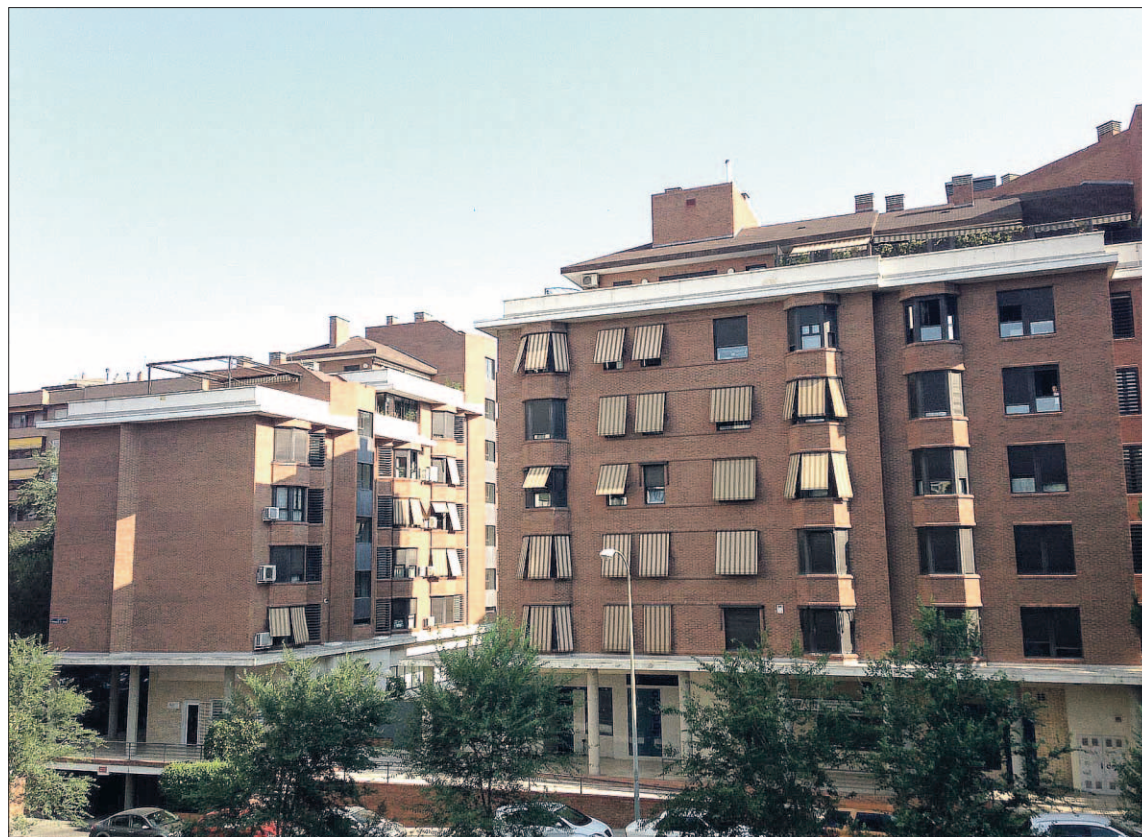
Los mercados internacionales prefieren que haya una estabilidad política para invertir en vivienda.

Pisos.com destaca que el mercado residencial español es uno de los más observados en el ‘real estate’ mundial, ya que