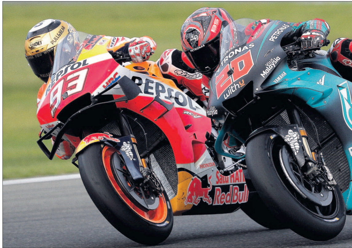
El piloto español y campeón del mundo, Marc Márquez (i), adelanta a Fabio Quartararo (d).

Terminó decimotercero, pero Cheste al completo despidió en pie al gran campeón, que quemó rueda por última vez. "No me ha defraudado porque como persona es un 10. Los resultados no han acompañado, pero es un hombre muy honesto y muy generoso. Pasará a la historia como un gran campeón", señaló emocionado el 'Team Manager' del Repsol Honda, Alberto Puig. La emoción en el box por la marcha del mallorquín se mezcló por la alegría de un nuevo triunfo de Márquez, que lideró un podio en el que le acompañaron el francés Fabio Quartararo (Yama-