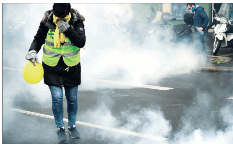
Un 'chaleco amarillo' durante las protestas del sábado en París.

Los agentes también habían llevado a cabo hasta entonces 639 controles para hacer cum-