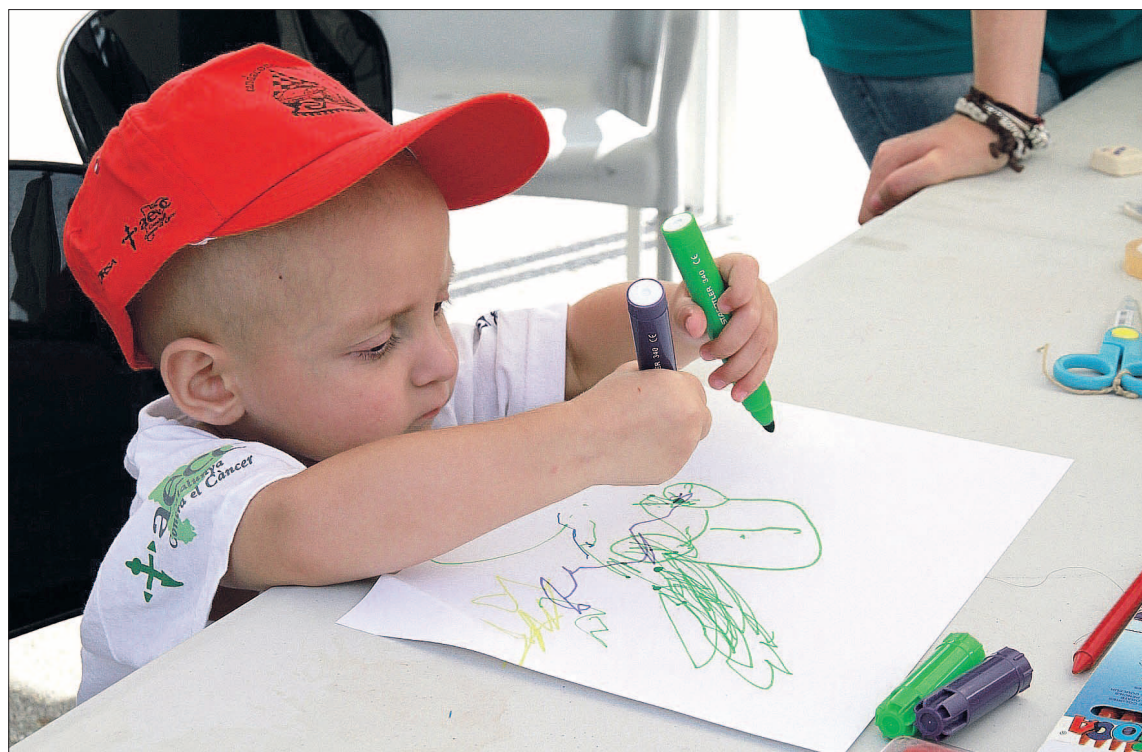
El Comité se encargará de garantizar la formación continuada y conjunta de los profesionales sanitarios.

Entre sus funciones destacan el análisis y definición de los criterios clínicos de actuación de Sacyl en los procesos oncológicos pediátricos, incluyendo el seguimiento de los pacientes; la coordinación asistencial entre todos los centros de Sacyl; la elab-