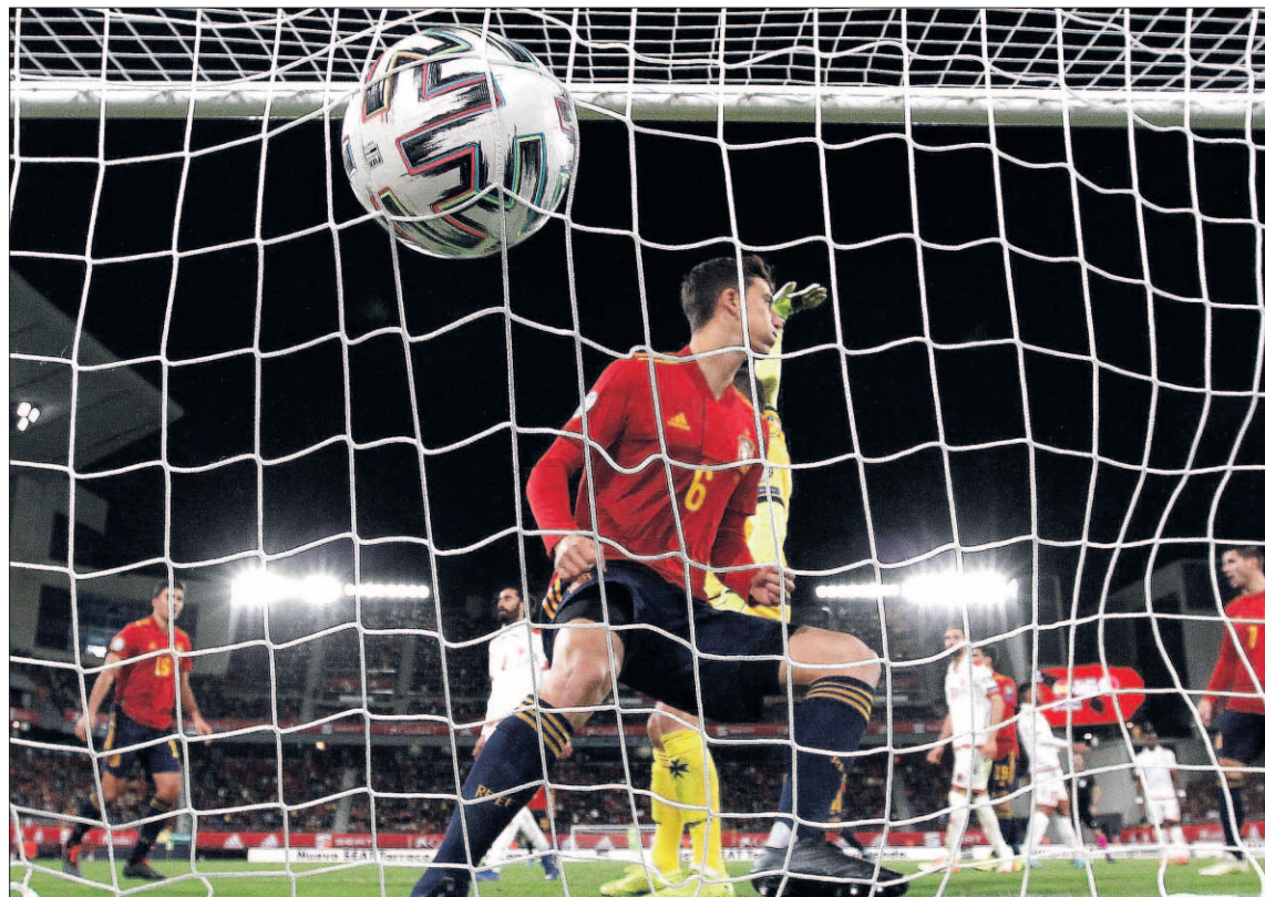
El defensa de la selección Pau Torres marca el tercer gol ante Malta, durante el partido del pasado viernes.

Robert Moreno: Al equipo le pongo un 10, y a nosotros también. Se ha dado todo. Pero también hay que ser humildes >>>