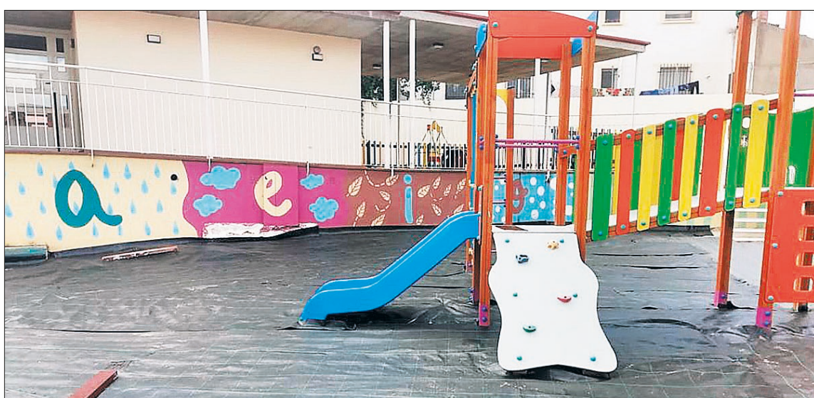
El nuevo arenero del colegio suple las deficiencias del anterior, cumpliendo con las demandas de madres y padres.