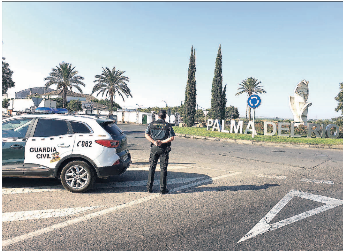
La Guardia Civil, en colaboración con la Policía Judicial lusa, detuvo al autor en la localidad de A Guarda.

VEHÍCULO CLAVE La minuciosa inspección ocular efectuada tanto en el lugar donde se produjeron los disparos, como en el vehículo que conducía la víctima, permitió identificar un vehículo que podría ser de interés para el esclarecimiento de los hechos, que los investigadores lograron relacionar con una persona de nacionalidad portuguesa que pudiera tratarse del autor