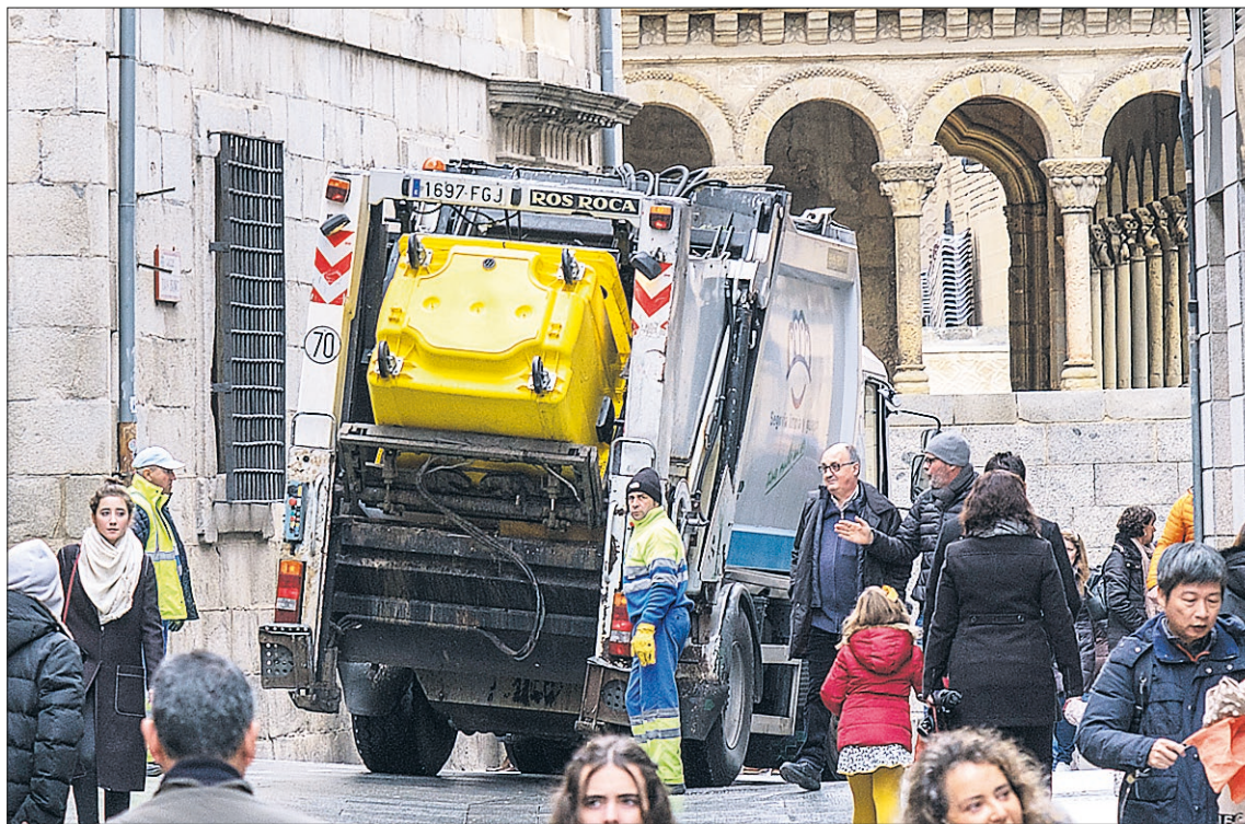
Un vehículo de recogida de envases domésticos, en la Calle Real de la capital segoviana.

Entre las tasas que generan ingresos a otros ayuntamientos y no figuran en la ficha de Segovia del informe se encuentran, entre otras, la de tenencia de animales potencialmente peligrosos (que generaron 2.650 euros al de Ávila en 2017); la de tra-