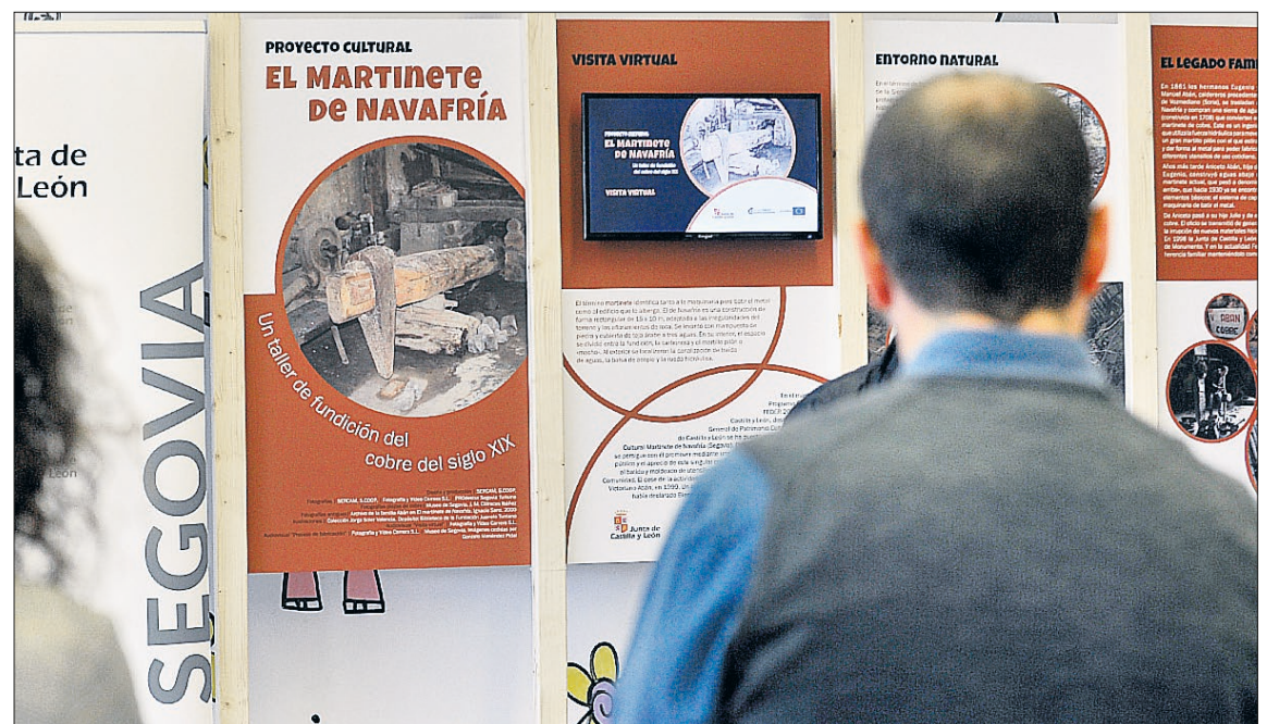
La muestra da a conocer el historia y el funcionamiento de este ingenio hidráulico. / KAMARERO

En dos de los seis módulos se han instalado pantallas de televisión en las que los visitantes pueden realizar un recorrido virtual por el Martinete, con explicación detallada de su historia y funcionamiento. Además, la muestra cuenta con una reproducción en madera de un martinete a pequeña escala que permite ver el mecanismo en movimiento.