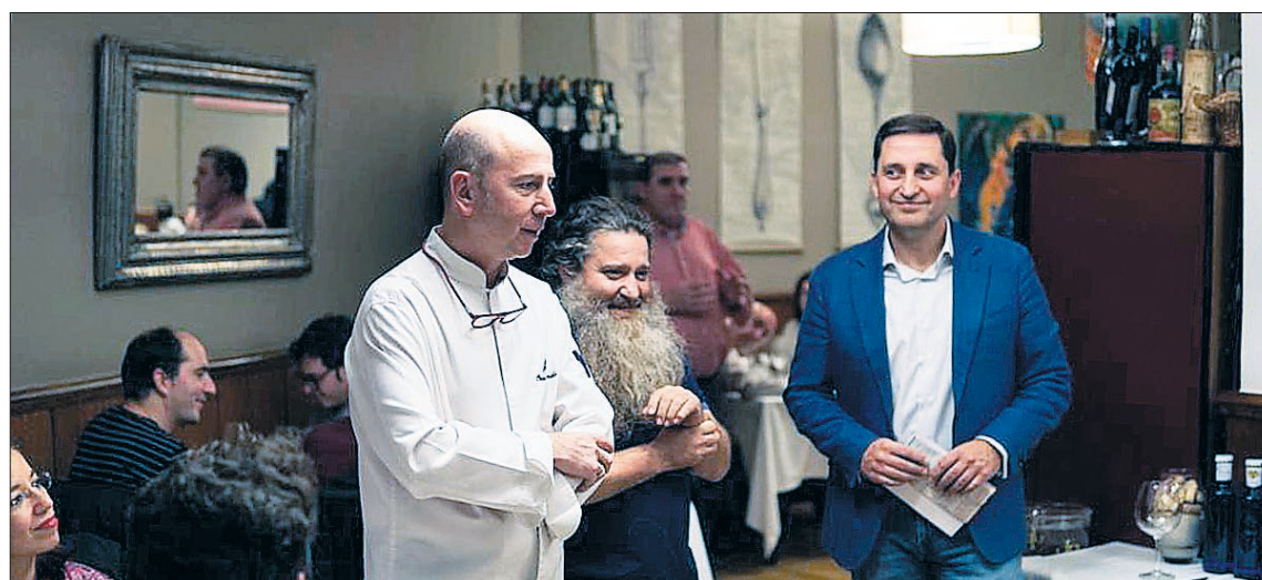
Aperitivo en el Hotel Los Arcos (arriba); y cena en el restaurante Maracaibo Casa Silvano (abajo).

gistrar. Para finalizar, un ribera: Bela, otra de las referencias de CVNE, que a pesar de tener un paso por madera más corto que el anterior, Elena y Héctor coloraron acertadamente en tercer lugar, dada la potencia que aporta el terroir de la Ribera del Duero a la tempranillo. Pura fruta, balsámicos, pimienta y un tanino muy pulido se fusionaban a la perfección con la tapa de carrillera, tan tierna como sabrosa, elegida para este tercer maridaje.