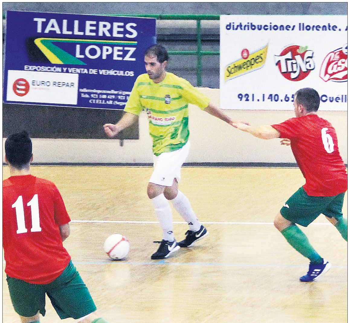
El jugador del FS Cuéllar Valco protege un balón ante la conformación del contrincante.