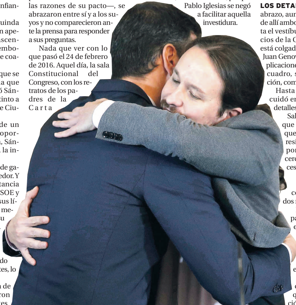
El acuerdo entre Pedro Sánchez y Pablo Iglesias ya se conoce como el ‘pacto del abrazo’.

Como la de aquel 30 de marzo de 2016, cuando Sánchez intentó sin éxito por última vez que Iglesias permitiera su investidura. Seguro que si acaban gobernando volvemos a verles bajar juntos la Carrera de San Jerónimo como lo hicieron aquel día. Porque ninguno de los dos lo puede negar: Les encanta una buena foto.