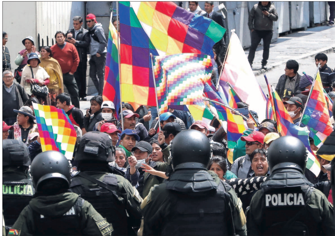
Al menos 20 personas han fallecido en enfrentamientos entre partidarios y detractores de Morales.

"Hago un llamado a mi pueblo, del campo o de la ciudad; pobres, humildes o pudientes que ostentan el poder económico, a