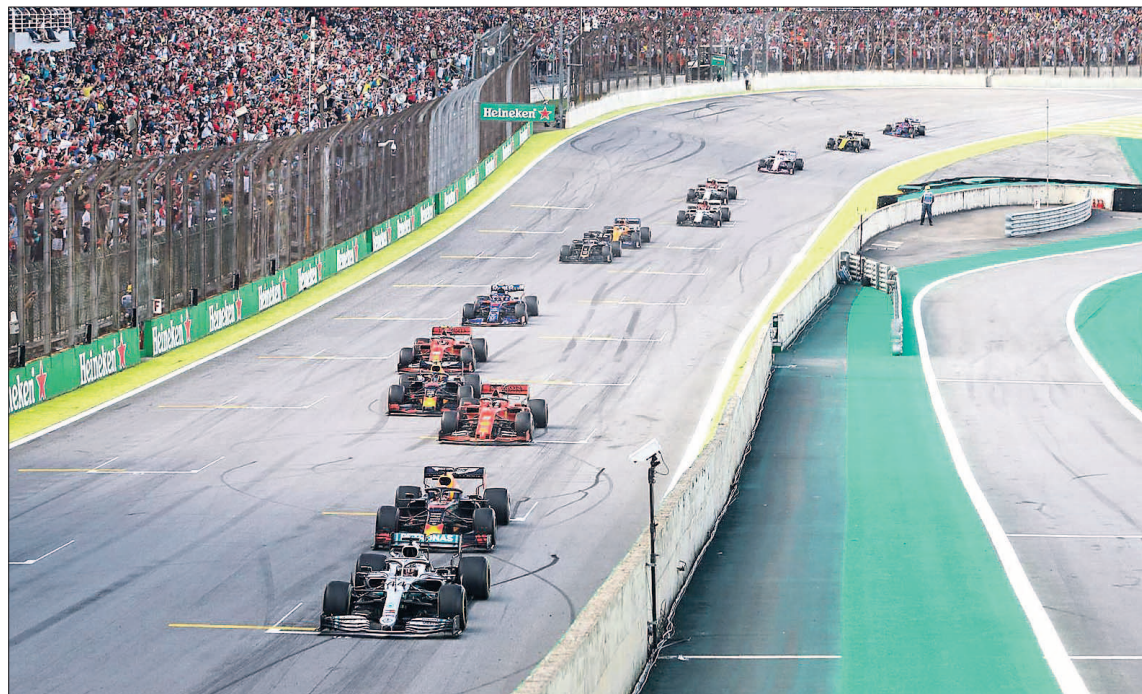
La carrera fue parada en varias ocasiones para que interviniera el safety car.

El de Red Bull guardó la pole mientras que el inglés, campeón del mundo ya desde hace dos semanas en Austin, ade-