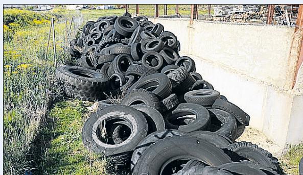
No se pueden almacenar neumáticos. / KAMARERO

Los residuos voluminosos y de enseres de origen domiciliario no peligrosos, se depositarán en las áreas de aportación, según establezca la ordenanza municipal de cada pueblo, para su recogida por el punto limpio móvil del Consorcio o un gestor de residuos autorizado. Hay que tener en cuenta que no se deben almacenar los siguientes tipos de residuos: tóxicos (baterías, envases de fitosanitarios, medicinas... o cualquier otro con esta consideración), líquidos en cualquier presentación (aceites, lodos, purines...), ruedas o neumáticos, residuos de origen no domiciliario, especialmente residuos de origen industrial. Los residuos de aparatos eléctricos y electrónicos