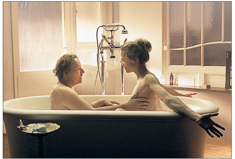
Fotograma de '1.001 gramos', película de Noruega, país invitado en esta edición.

Pero Muces ofrece mucho más, aunque sea lunes, y, por ejemplo, el chef Rubén Aranz presentará esta tarde, desde las 18 horas en la Sala Fundación Caja Segovia, su libro 'Ancha es Castilla, nueva cocina castellana', antes de la proyección de la película 'Y en cada lenteja un dios'.