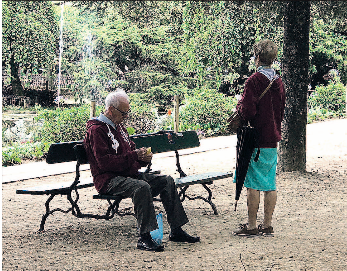
El 73% de los encuestados considera que su pensión no será suficiente para mantener su nivel de vida actual.

Así, para entonces una persona cobrará de pensión la mitad del dinero que percibía mensualmente de su trabajo. Sobre este tema, el 24% de los españoles considera que su pensión pública supondrá menos del 50% de sus ingresos totales en el momento de la jubilación, mientras que un 9% considera que será el