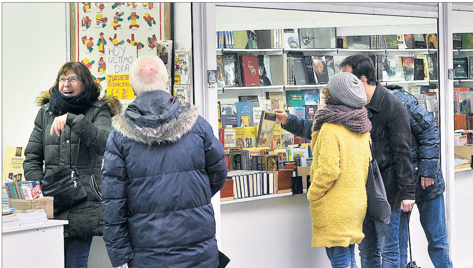
El buen ambiente que se respira en esta feria hace que sean muchas las personas que disfrutan con los libros y las historias que les cuentan sobre ellos.