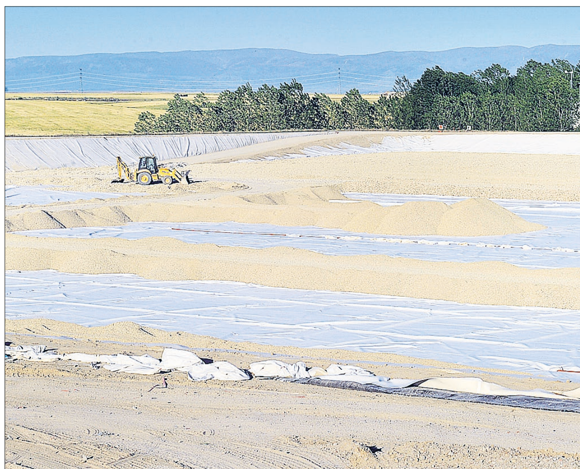
Imagen de archivo de la ejecución de uno de los vasos del depósito de rechazos.

Cabe señalar que la provincia de Segovia dispone de un Centro de Tratamiento de Residuos en Los Huertos, un depósito de rechazos en Martín Miguel, cinco plantas de transferencia en las localidades de Boceguillas, Cantalejo, Cuéllar, El Espinar y Nava de la Asunción, catorce puntos limpios para la recogida selectiva de residuos en las localidades de Boceguillas, Cantalejo, Coca, Cuéllar, Garcillán, El Espinar, Hon-