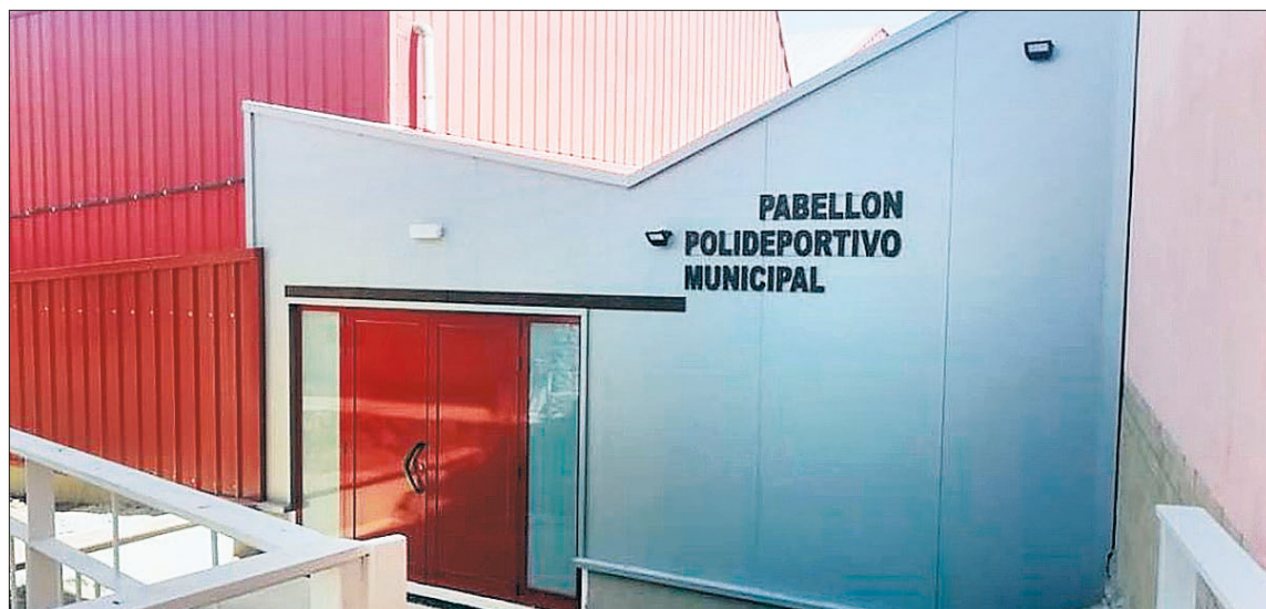
Entre las mejoras realizadas en el polideportivo municipal se encuentra la nueva puerta que da acceso a las gradas.

Además, cabe señalar el avance en la edificación del nuevo gimnasio municipal, iniciada en el mes de agosto y que finalizará en 2020. Un proyecto que surge por la demanda no solo de los más jóvenes, sino también del servicio médico.