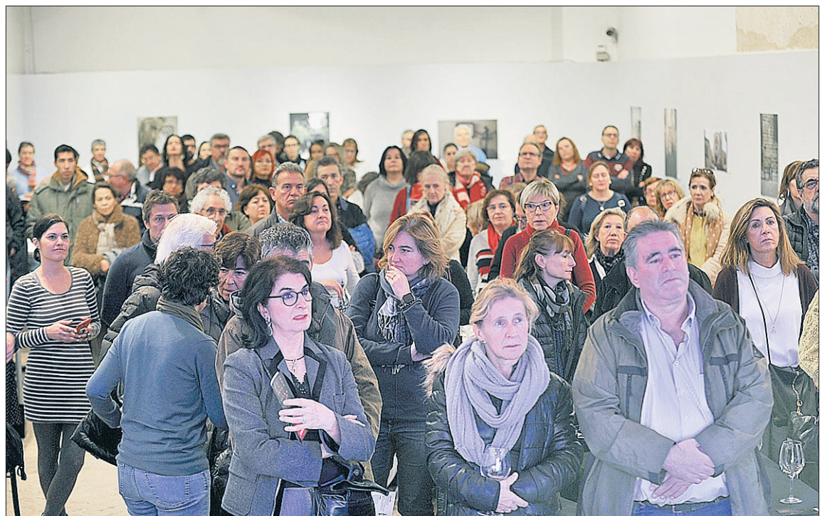
Expectación para participar en este 'duelo de vinos', que comenzó con retraso. / KAMARERO

bodeguero acompañados de productos segovianos, así como quesos noruegos –Noruega es este año el país invitado a la Muestra– y de torreznos de chocolate. Se trató de una actividad a la que se accedía por invitación, con caldos elaborados con la coordinación de Almudena Alberca, primera mujer española 'Master of Wine' .