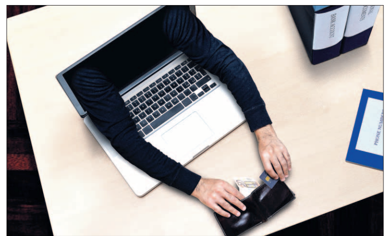
Las pérdidas financieras, la mayor preocupación de las empresas.

Sin embargo, la respuesta debería ser distinta: "Con el fin de aprovechar completamente las ventajas que ofrece la tecnología, las empresas deben escuchar las preocupaciones de sus clientes para ofrecerles soluciones adaptadas a sus necesida-