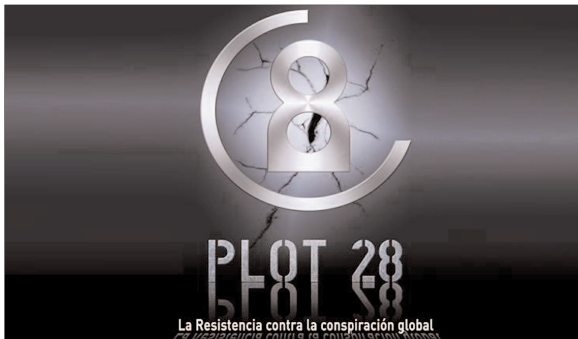
El proyecto comenzó con un falso documental llamado 'Parcela 28' y se ha desdoblado en varias plataformas. / PLOT28

Pero, ¿qué es una novela transmedia? El lector no tarda en descubrirlo al abrir el libro, ya que entre el texto aparecen códigos QR que a través del móvil dirigen