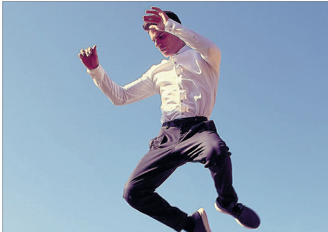
El tejido favorece la dilatación de los capilares sanguíneos, por lo que la sangre fluye mejor y aporta oxigenación al cuerpo.