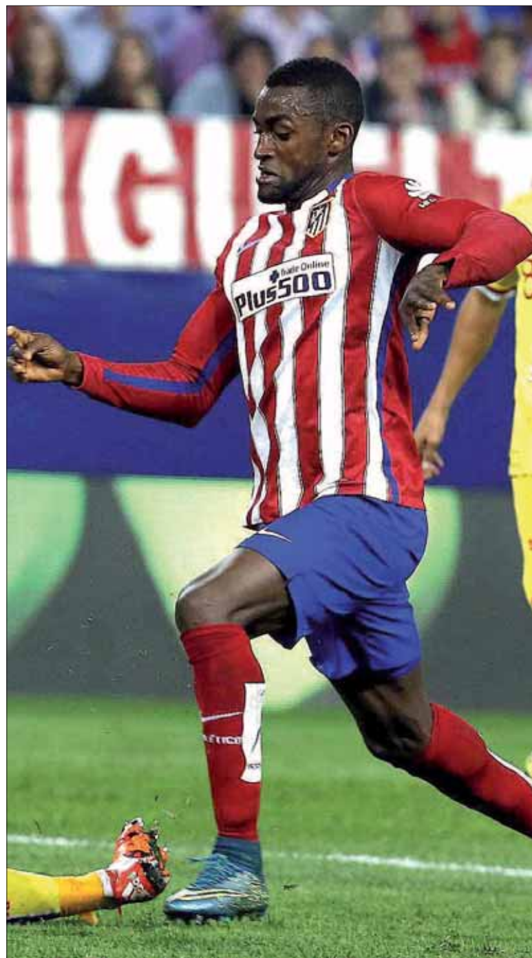
El Atleti pagó 35 millones por Jackson en verano y ahora lo ha vendido por 42.

A nivel individual, el delantero francés del Real Madrid, Karim Benzema, es el goleador más efi-