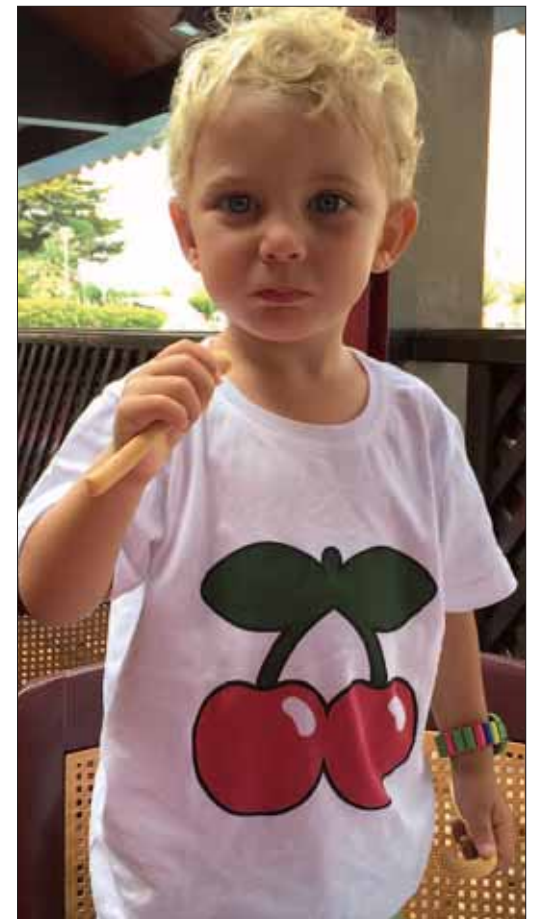
CUMPLEAÑOS. Pues ya llegaron los 3 Leo !! Que rápido pasa el tiempo, muchas felicidades de parte de toda la familia. Te queremos.