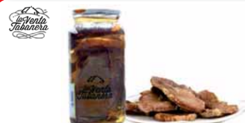
Lomo en aceite La Venta Tabanera 490gr

P.V.P. 1,99 €/ud si eres socio 1,50 €/ud te devolvemos 0,49€/ud en tu tarjeta