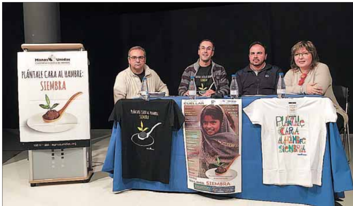
Presentación de la campaña con los sacerdotes locales, la conejala de Cultura y un voluntario.

‘Plántale cara al hambre: siembra’, resume como lema el programa de este 2016. El objetivo de este año es la construcción de un colegio internado para niñas tribales en la India. La localización concreta es Deogarh, Odisha, una aldea de la Diócesis de Sambalpur, en la Costa Este de la India. Se trata de una población rural en la que la mayoría de habitantes subsiste gracias a la agricultura, pero el terreno cultivado no es suficiente para todas las familias. Existe un alto nivel de emigración y los niños, al vivir en zonas rurales aisladas, tienen grandes dificultades de acceso al colegio. Las hermanas de la congregación ‘sisters of the Cross Chavanod’ solicitan la construcción de un edificio nuevo del internado—ya existente—, pa-