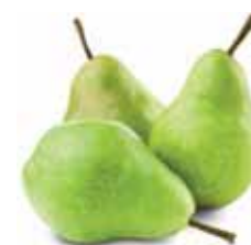
Pera blanquilla a granel

P.V.P. 9,50 €/kg si eres socio 7,95 €/kg te devolvemos 1,55€/kg en tu tarjeta