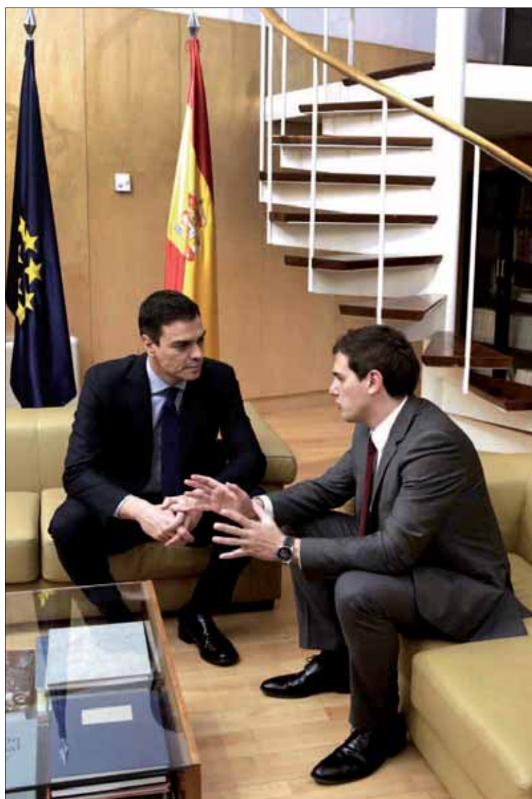
Albert Rivera (d) protagonizó el único encuentro de ayer de Pedro Sánchez.

De esta manera, volvió a explicar que la semana próxima convocará al líder del PP a una reunión, por "respeto a los siete millones" de españoles que les votaron el pasado 20 de diciembre, pero insistió en que no ve espacio de entendimiento, porque el "suma y sigue" de este partido con la corrupción.