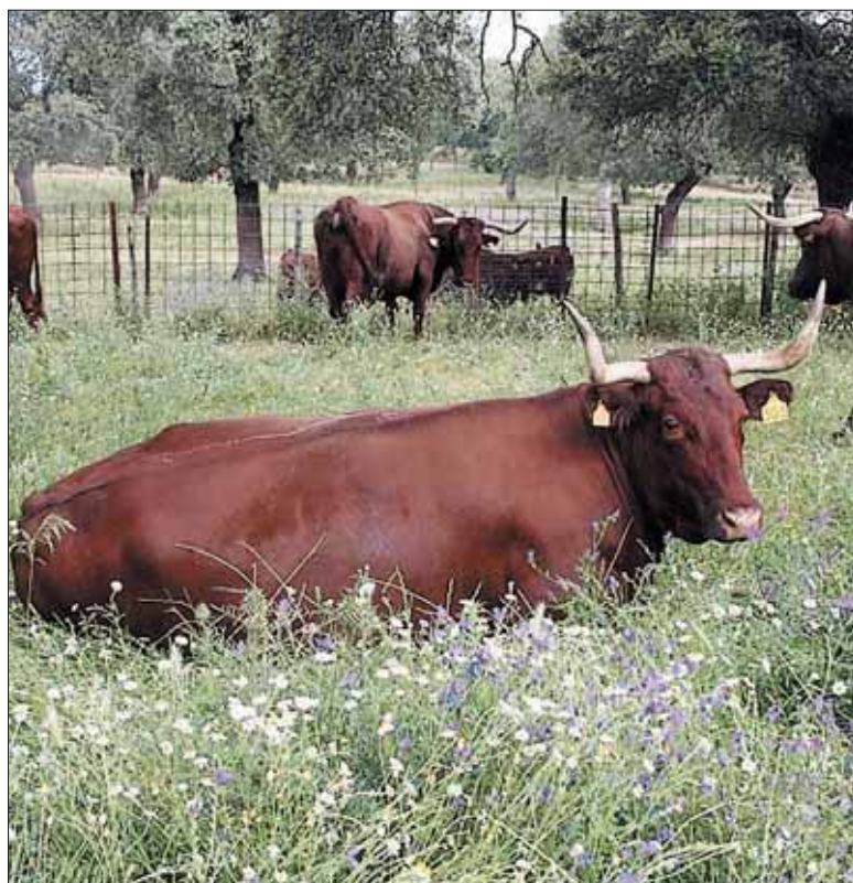
Varios ejemplares vacunos en un campo salmantino.

Stéphane Joost, investigador de la Escuela Politécnica Federal de Lausana (EPFL), considera que durante el siglo XX se extinguió el