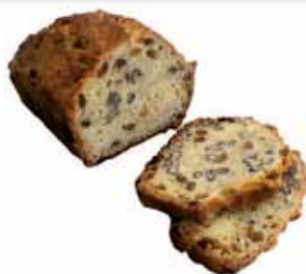
Plum Cake de nueces de 300gr

P.V.P. 1,99 €/ud si eres socio 1,75 €/ud te devolvemos 0,24€/ud en tu tarjeta