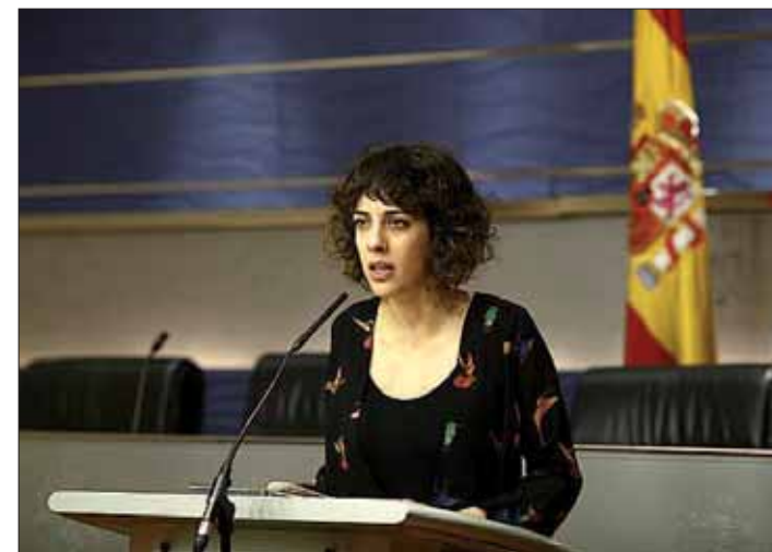
La portavoz parlamentaria de En Marea, Alexandra Fernández.

Entre las cuestiones que En Marea pondrá sobre la mesa figuran, por ejemplo, la necesidad de poner en marcha un plan de reindustrialización para la Comunidad gallega; medidas específicas para el cerco y el lácteo; y “dar respuesta a la plurinacionalidad” del Estado.