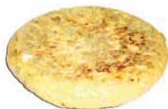
Tortilla fresca con cebolla 500gr Eroski

P.V.P. 11,30 €/ud si eres socio 9,95 €/ud te devolvemos 1,35€/ud en tu tarjeta