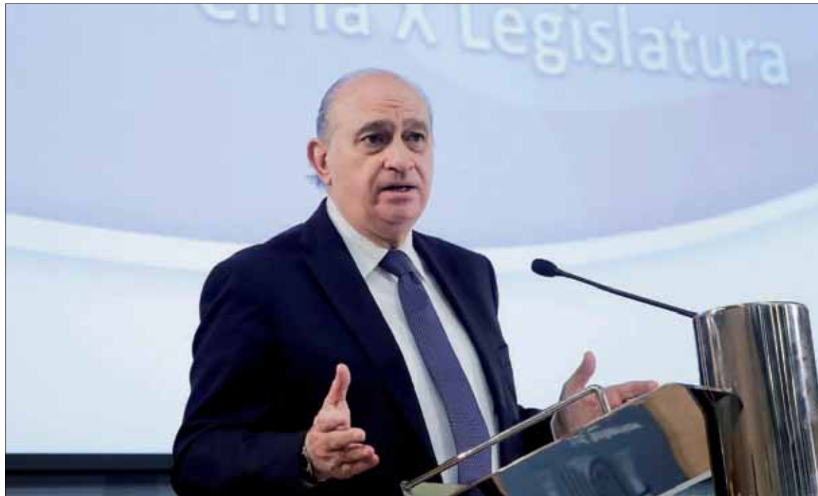
El ministro del Interior en funciones, Jorge Fernández Díaz, durante la presentación del balance de criminalidad.

“Es necesario poner de relieve que en estos cuatro años España ha sido un país más segu-