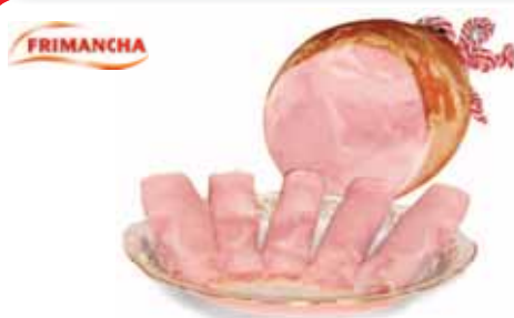
Lacón asado frimancha 200gr

P.V.P. 3,95 €/ud si eres socio 3,25 €/ud te devolvemos 0,70€/ud en tu tarjeta