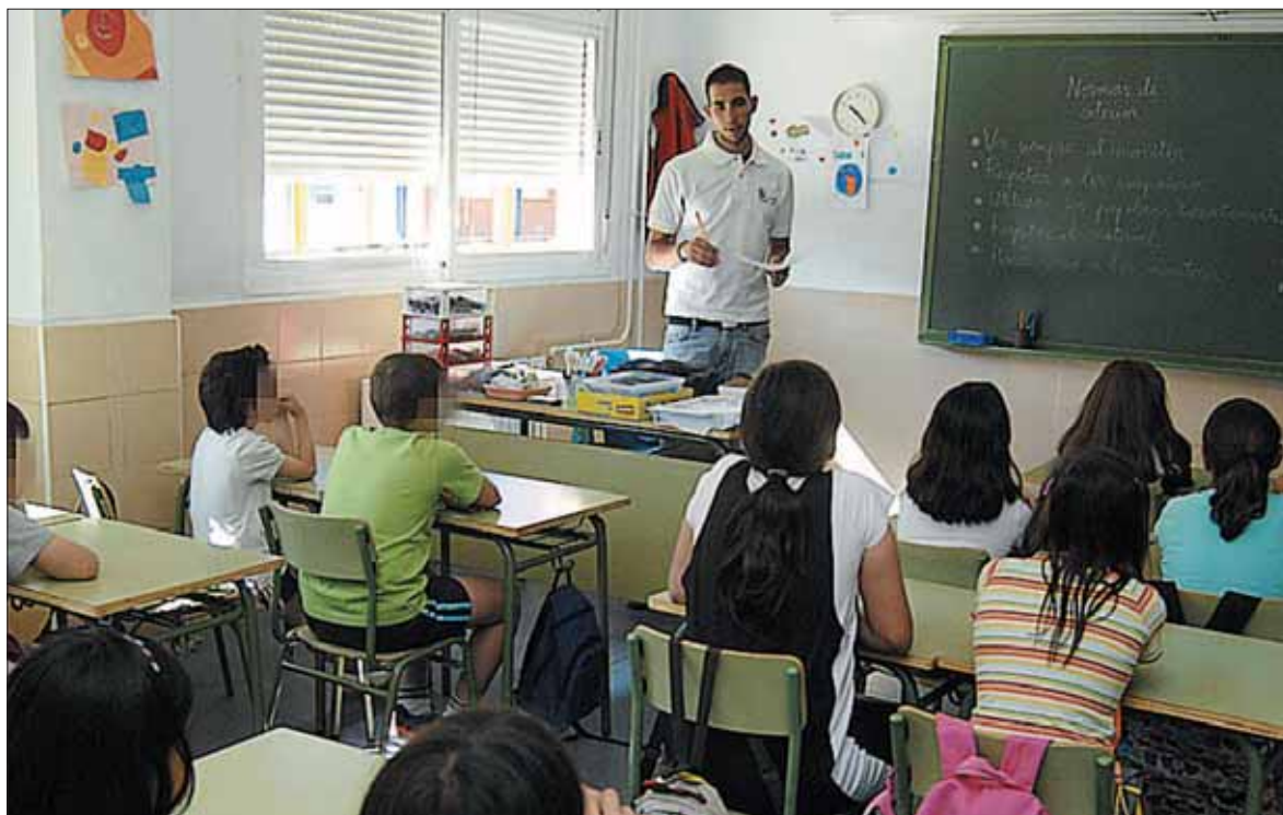
El programa de actividades para periodos de vacaciones está destinado a escolares de entre 3 y 12 años.

'Conciliamos' se dirige a niñas y niños de entre 3 y 12 años cuyos