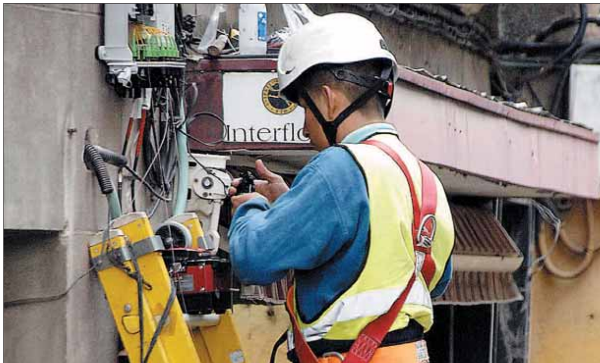
Un operario desarrollando labores de instalación de fibra óptica en una calle de Segovia.