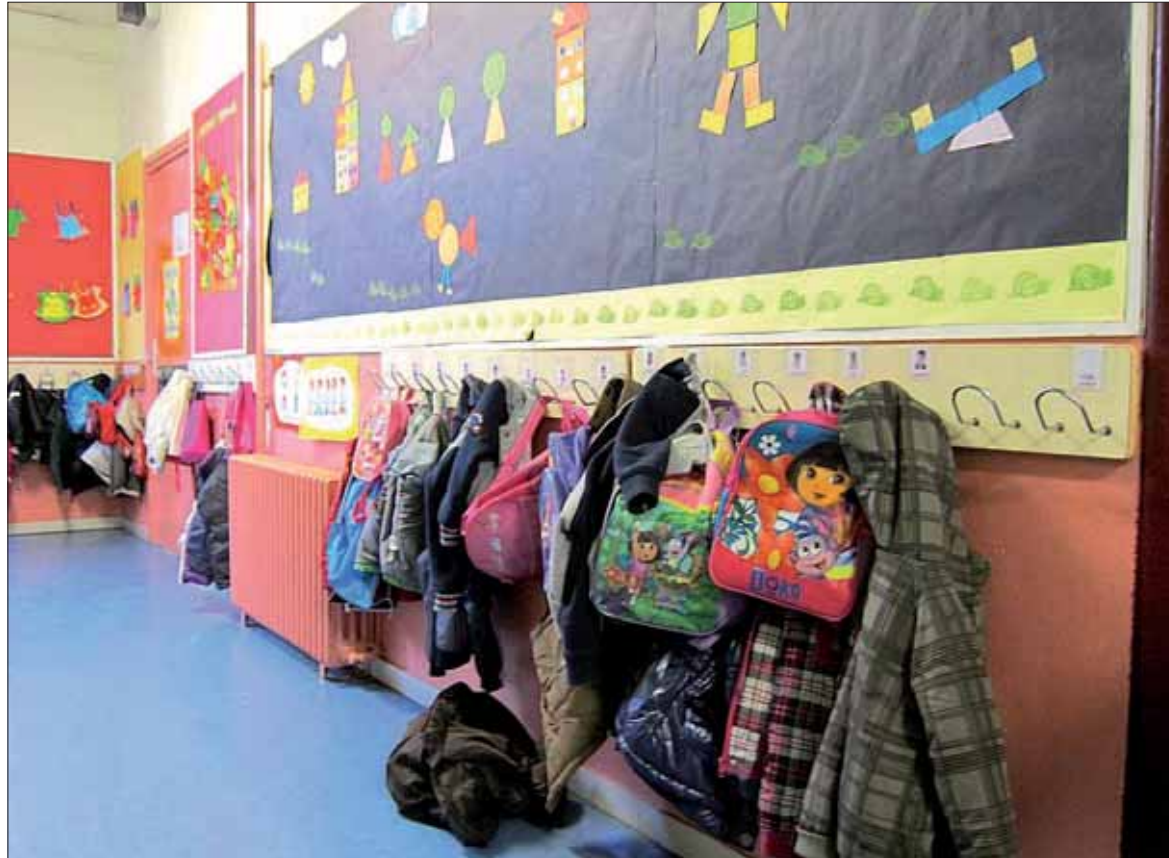
La Consejería de Educación cree que este sistema permitirá al profesorado explicar los contenidos de forma más motivadora.

EVALUACIÓN Desde la consejería, también consideran que la evaluación de estos procesos proporciona al profesorado "información muy precisa" sobre la comprensión por parte de los alumnos de los conceptos y conocimientos curriculares que se estén trabajando, "ya que estos tienen que apli-