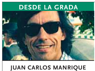
DESDE LA GRADA