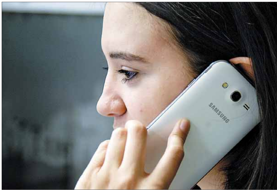
La nueva red permitirá incrementar la velocidad de los servicios telefónicos.

Para garantizar la compatibilidad de la nueva tecnología con la Televisión Digital Terrestre (TDT), los operadores han puesto en marcha Llegas800, entidad encargada de solucionar cualquier afectación en la recepción de la señal de televisión. Con la llegada del nuevo 4G