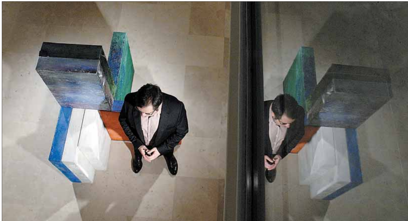
El artista, ayer, junto a una de las instalaciones pictóricas que se exhiben en la muestra. / JUAN MARTÍN

De esta manera, unos cuadros bidimensionales conviven con otros tridimensionales; piezas que son prácticamente pinturas objeto colgadas en la pared estarán junto a otras que se independizan del muro y que forman una instalación pictórica. Así, la exposición invita al espectador a “rodear la obra”, tanto desde su sensibilidad visual como desde su posición física. “Es una muestra