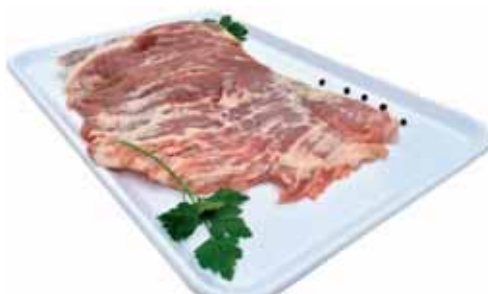
Secreto cerdo al vacio

P.V.P. 0,85 €/ud si eres socio 0,65 €/ud te devolvemos 0,20€/ud en tu tarjeta