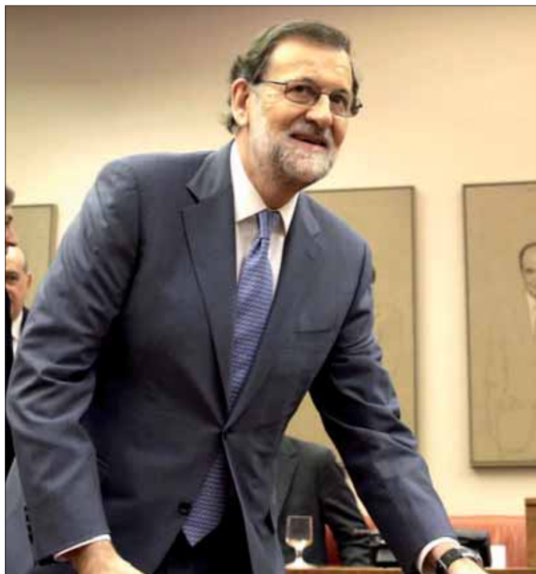
Mariano Rajoy confía en que el PSOE no sea capaz de encontrar apoyos.

Rajoy señaló que el Gobierno de Sánchez “va a necesitar” a Podemos, IU y el apoyo de los partidos independentistas, “sea con su voto positivo, la abstención o una ausencia”, y recalzó que ese respaldo no será “gratis”. A su entender, sería un Gobierno “hipotecado”, un “lastre” y una “amenaza cierta” para la recuperación económica del país.