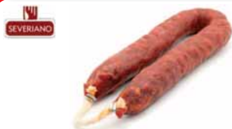
Chorizo extra Severiano de León 350gr dulce o picante

P.V.P. 3,95 €/ud si eres socio 3,25 €/ud te devolvemos 0,70€/ud en tu tarjeta