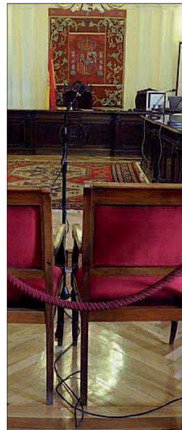
Sala de la Audiencia de León.