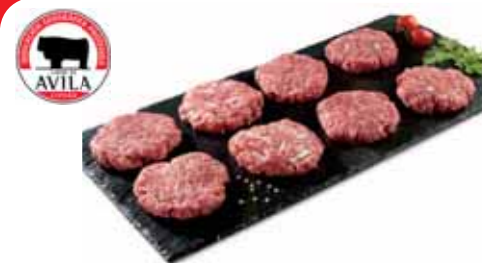
Mini Hamburguesas de Carne de Ávila 12 unidades

P.V.P. 7 €/kg si eres socio 5 €/kg te devolvemos 2€/kg en tu tarjeta