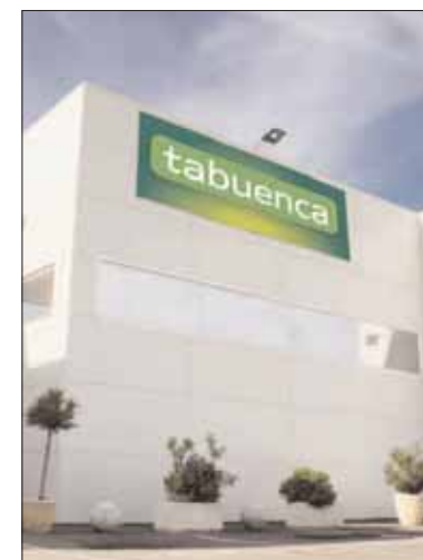
Fachada de la empresa.

Por otro lado la empresa continúa su apoyo a la línea 'Tabuena Tiernos' que lanzó en el último trimestre de 2015, ofreciendo un producto de calidad, recolectado en el momento justo de madurez para conseguir un sabor característico. Como resultado del esfuerzo realizado, los consumidores podrán encontrar esta gama próximamente en los lineales de las grandes superficies.