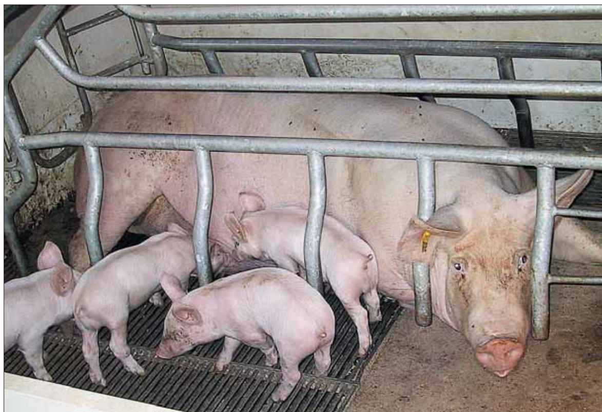
El porcino mantiene precios bajos desde hace varias semanas debido al exceso de oferta de animales.

La operación de almacenamiento privado ya terminó. Se han acogido a esta posibilidad un total de 90.000 toneladas (el 80% entre Alemania, España, Dinamarca y Holanda). La inusitada rapidez con que se ha llegado a estas 90.000 toneladas ya denota en sí misma que oferta no ha faltado. En España se han consignado 19.000 Tm, equivalentes a unos 240.000 cerdos o lo que es lo mismo, un 25% de la actividad semanal. Estas 90.000 toneladas representan menos que el sacrificio de dos días hábiles en el conjunto de