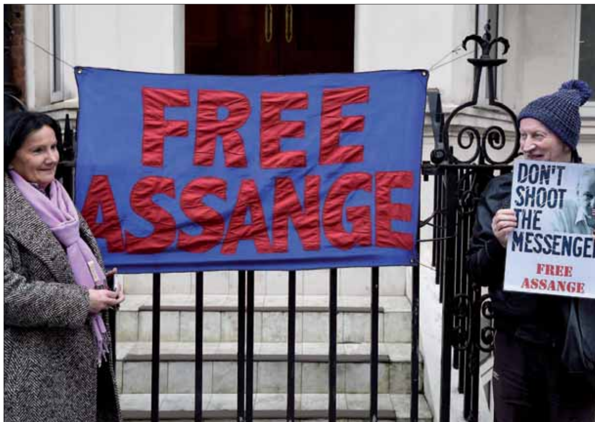
Partidarios de Julian Assange permanecen en el exterior de la embajada ecuatoriana en Londres, donde se encuentra.

La Policía británica advirtió de que "la orden de arresto sigue en vigor" y, por tanto, detendrá a Assange si abandona la legación diplomática ecuatoriana. Assange lleva recluso en la Embajada ecuatoriana en Londres desde el 19 de junio de 2012, cuando solicitó asilo político al país sudamericano. Aunque éste se lo concedió, Reino Unido se negó a darle un salvoconducto, insistiendo en que tiene la "obligación legal" de extraditarle a Suecia. Asegura que es víctima de una "persecución política" por parte de Estados Unidos