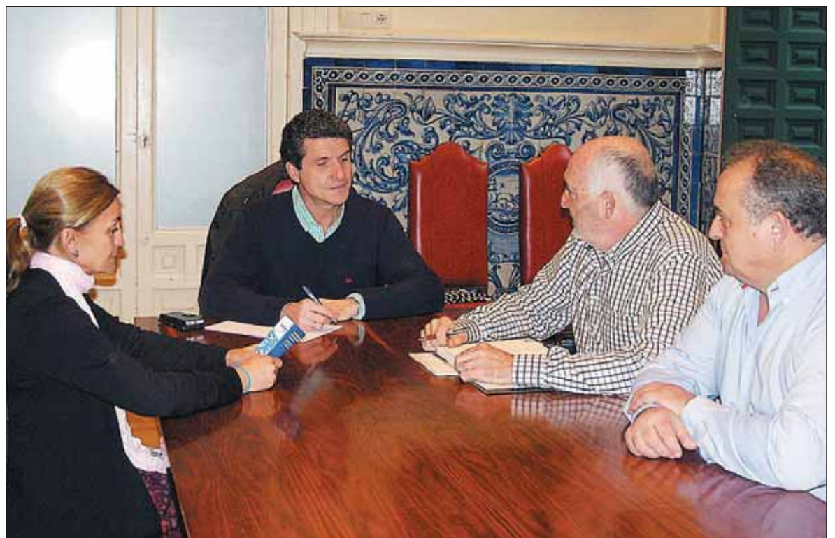
Los representantes de la asociación de San Marcos en el encuentro con el concejal de Participación Ciudadana.

En la reunión, los vecinos se interesaron también por cuestiones relativas al Plan Especial de Áreas Históricas (PEAHIS), cuyo documento final está a disposición de los ciudadanos en el Colegio Oficial de Arquitectos; así como por el recientemente aprobado reglamento de Participación, cuyas características más singulares fue-