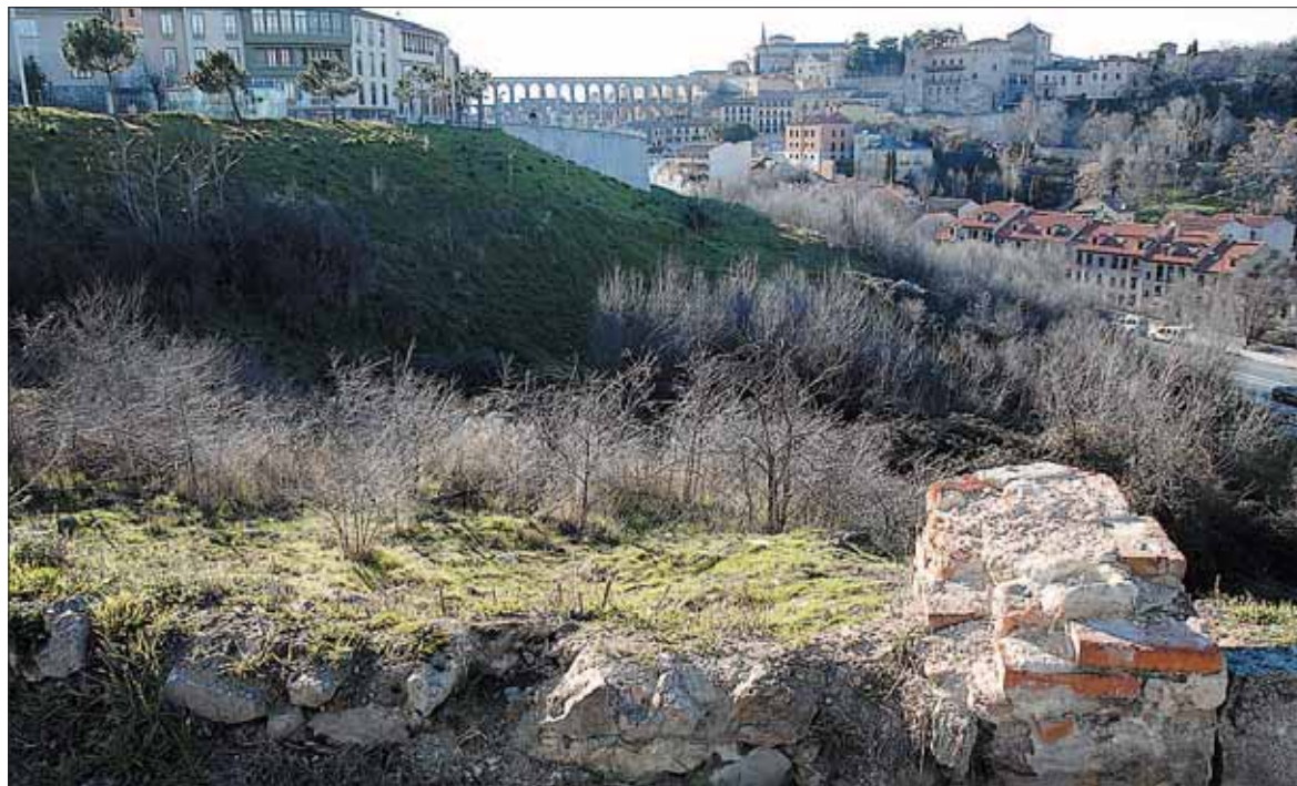
El terreno expropiado se encuentra en el paraje de Los Alamillos y el Cerrillo (entre San Gabriel, Vía Roma y Padre Claret).

El Alto Tribunal estimó parcialmente la reclamación de los propietarios en una sentencia de 2 de marzo de 2015 que, sin embargo, no admitía el justiprecio relativo al aprovechamiento bajo rasante del talud, motivo por el cual los interesados habían interpuesto el