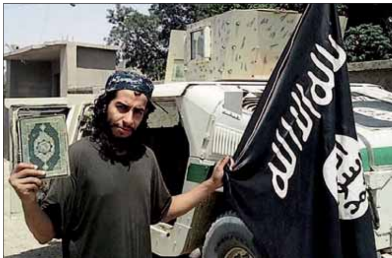
El 'cerebro' de los atentados del 13-N, Abdelhamid Abaaoud, continúa huido.

Las autoridades, sin embargo, rehusaron confirmar estos datos ni tampoco aclararon detalles sobre el supuesto plan terrorista en