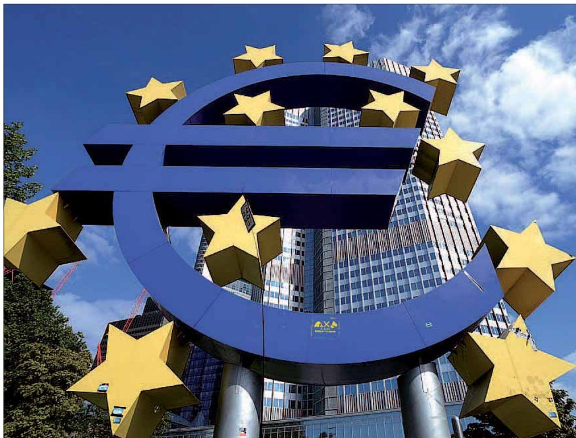
El Ejecutivo comunitario ya advirtió en otoño que España debería revisar los Presupuestos Generales de este año.

En lo que al crecimiento se refiere, Bruselas señala una leve reducción en el tercer trimestre de