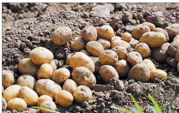
El texto busca diagnosticar más eficientemente las enfermedades. / E. A.

El Reglamento Técnico tiene como finalidad adaptar la legislación específica de control y certificación de patata de siembra a determinadas circunstancias que inciden directamente en la producción y comercialización de este cultivo en nuestro país, así como ajustar todos los requisitos técnicos a los establecidos en la Directiva de base de la Unión Europea relativa a la comercialización de este tipo de patatas.