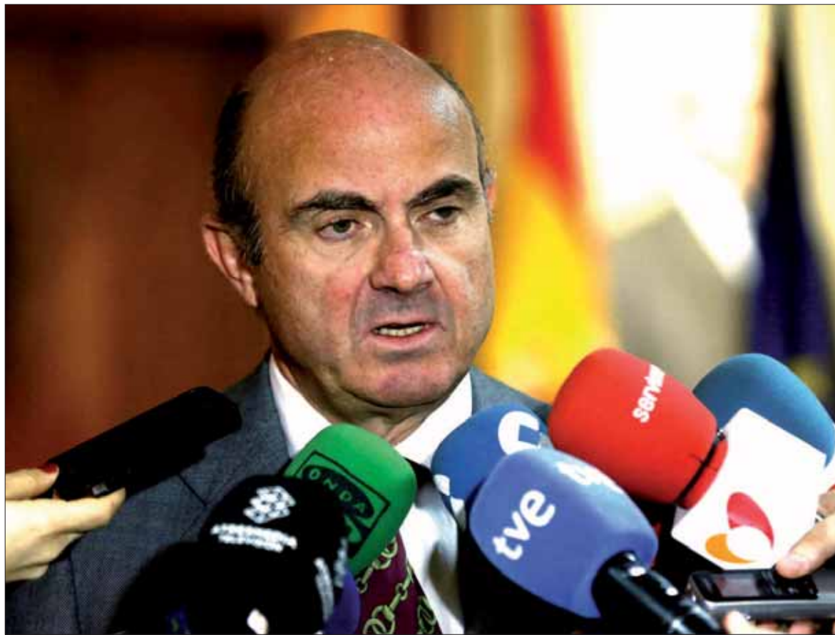
El ministro de Economía en funciones confió en formar un Gobierno antes de que afecte al crecimiento del país.

"Eso se podría corregir sin demasiado problema", opinó De