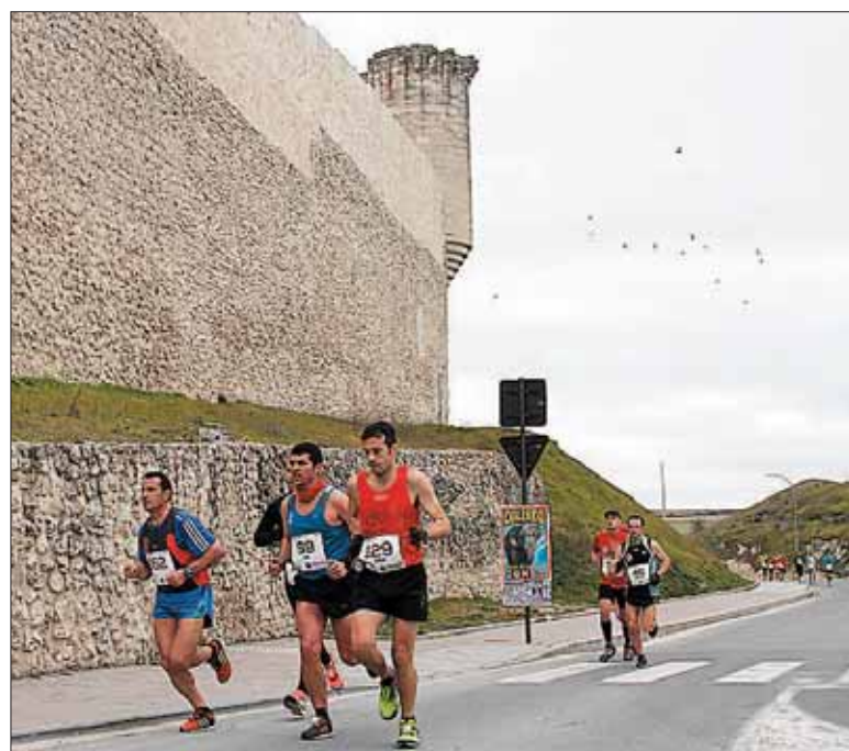
Corredores de la IV edición de la Carrera de las Murallas.

El límite de inscripciones está en los 350 dorsales, cincuenta más que el año pasado, y las previsiones auguran un “no hay dorsales muy pronto”, por lo que animan a la previsión a los interesados.