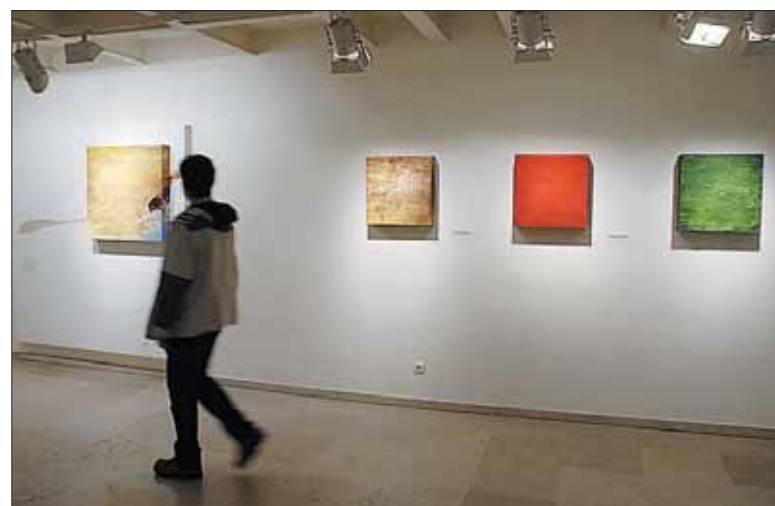
La exposición se ubica en tres salas del Museo. / JUAN MARTÍN

interactiva, un paisaje de pinturas”, subrayó el artista.