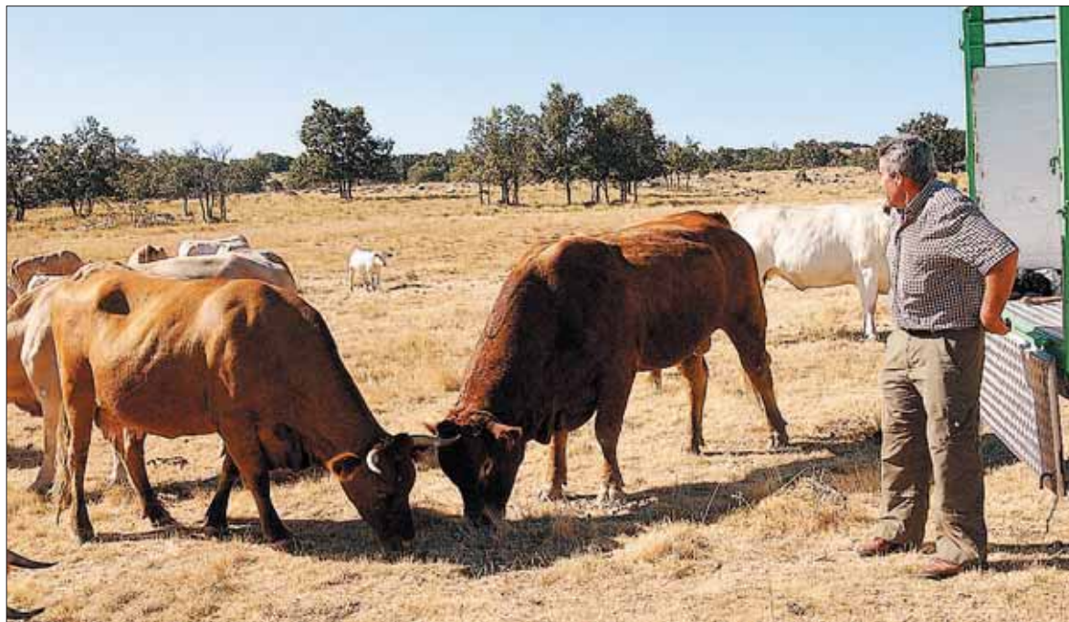
Un ganadero de vacuno alimentando a sus animales en una granja de extensivo.

La resolución recoge que la actividad conjunta 'Producción/Comercialización del Ganado se es-