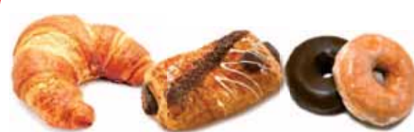
Desayuno Familiar. 1 croissant, 1 napolitana de chocolate, 2 berlinas (natural y chocolate)

P.V.P. 2,50 €/ud si eres socio 1,95 €/ud te devolvemos 0,55€/ud en tu tarjeta