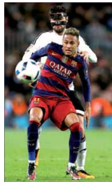
Neymar, defendido por Barragán.

Sobre el futuro de su hijo aseguró que no tienen prisa por renovar. "Aún le quedan 2 años y medio de contrato. Pero pueden estar muy tranquilos, mi hijo está muy feliz aquí", aseguró, en una idea que comparte, según sus palabras, el club azulgrana. "Estamos tranquilos y somos optimistas, contamos la verdad", apuntó sobre su declaración ante el juez.