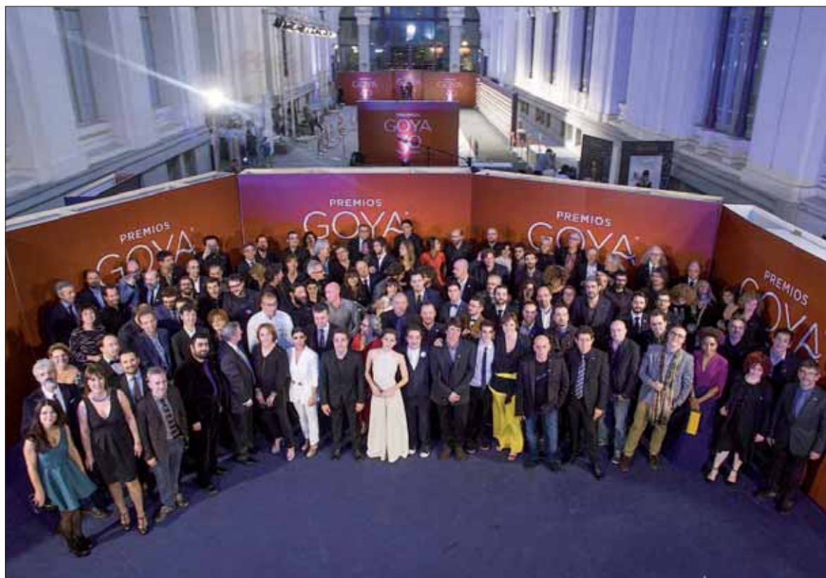
Foto de familia de los nominados e invitados en la tradicional fiesta previa a la gala de los 30 Premios Goya de mañana.

Años después, se encargó al escultor José Luis Fernández una nueva estatuilla con un busto en bronce, más pequeño, que repre-