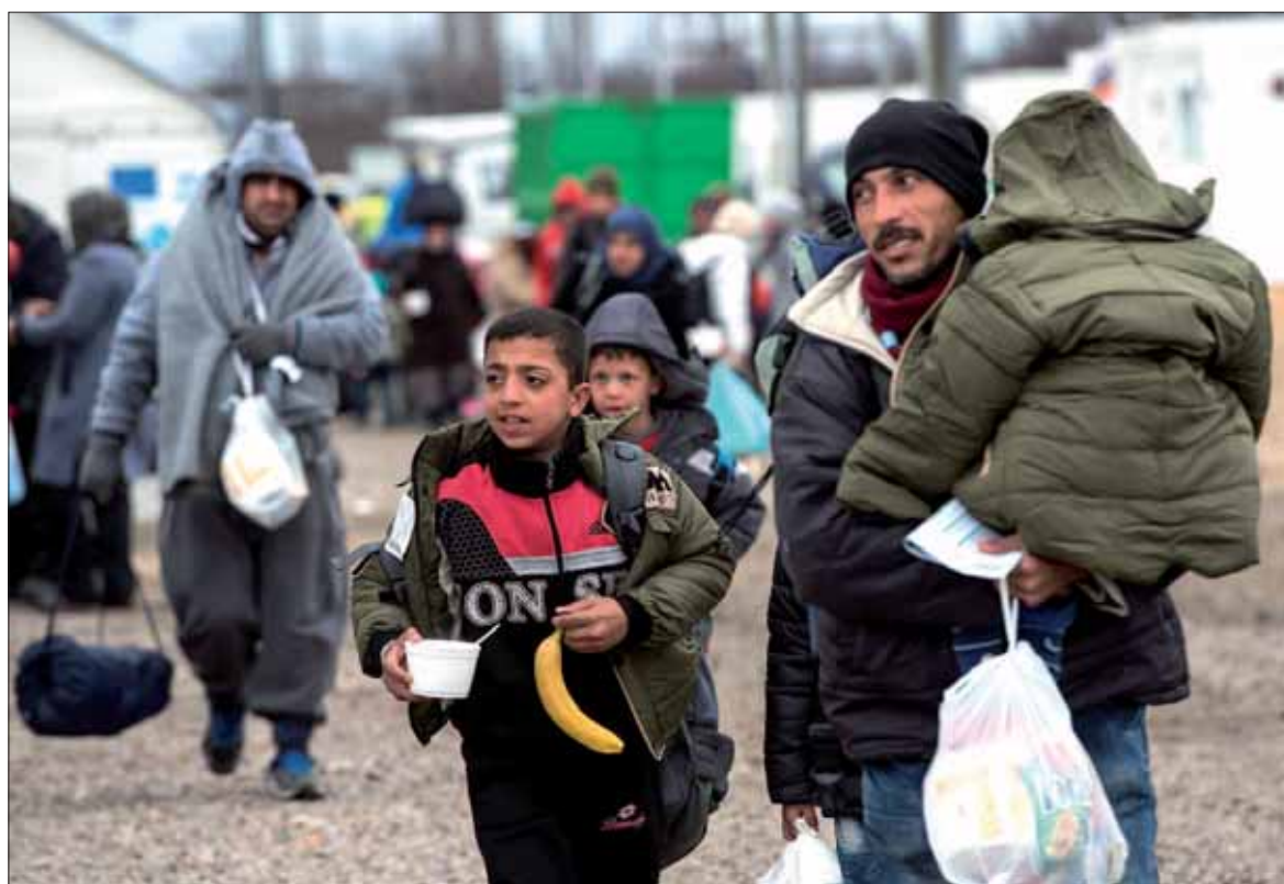
Las cantidades prometidas a nivel internacional para ayudar a los refugiados no alcanzan los objetivos marcados por la ONU.

El presidente del Consejo aseguró que, a través de esta ayuda, la UE espera ofrecer una "mejor vida" a millones de personas. "Los refugiados tienen pocas posibilidades además de huir de su país. Muchos de ellos han perdido todo y ahora, después de muchos años de conflicto, han perdido la esperanza. Tenemos el deber moral de devolvérsela", manifestó Tusk. Por su parte, Mogherini llamó de nuevo a en-