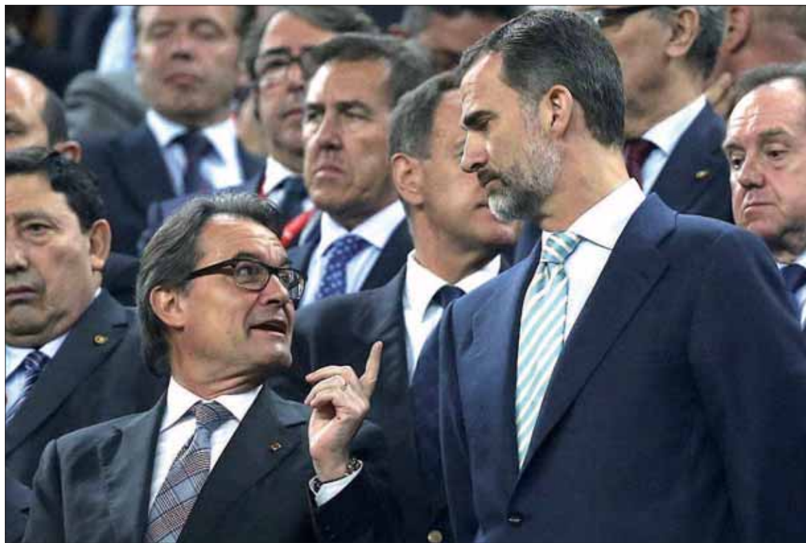
El por entonces presidente de la Generalitat, Artur Mas (izq), conversa con Felipe VI durante la final de la última Copa.

Manos Limpias se querelló el pasado junio en los juzgados de Barcelona contra el club azulgrana y el Athletic por un supuesto delito de ultraje a España y otro contra los derechos fundamentales al considerarles "responsables