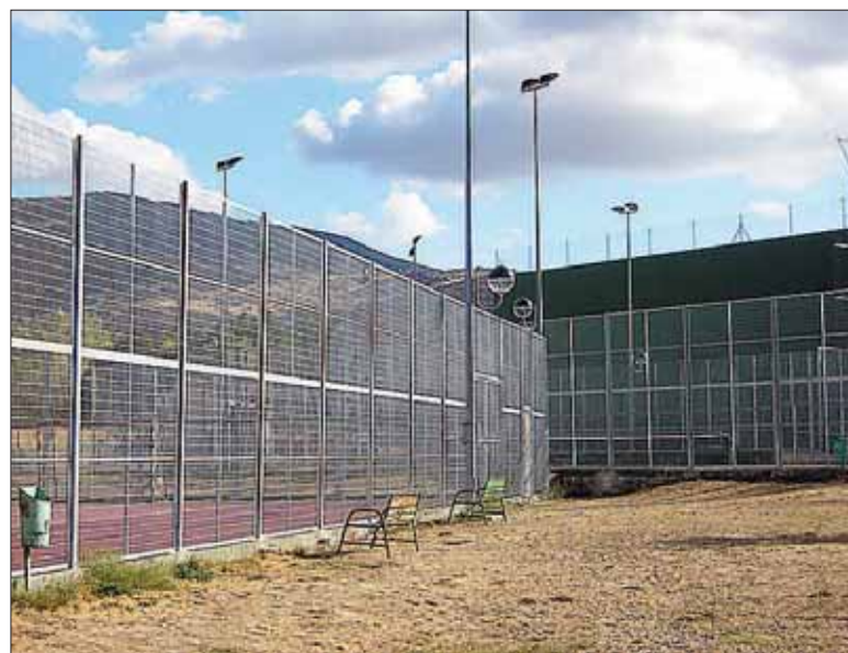
Uno de los robos ha sido cerca de la pista polideportiva.

"Es la mejor defensa que tenemos en estos pueblos pequeños