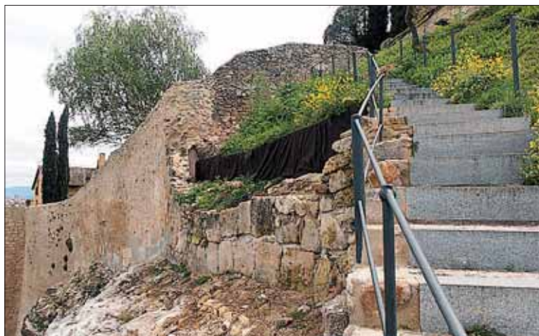
La escalera tapa parte del trazado medieval de la Muralla.

Las obras se ejecutarán entre el cubo 60 de la Muralla y la propia