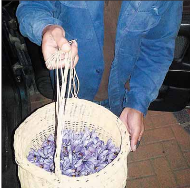
Flores de azafrán recogido en una explotación familiar de Segovia.

Las cifras de producción en España no se ajustan a las que corresponden a las exportaciones