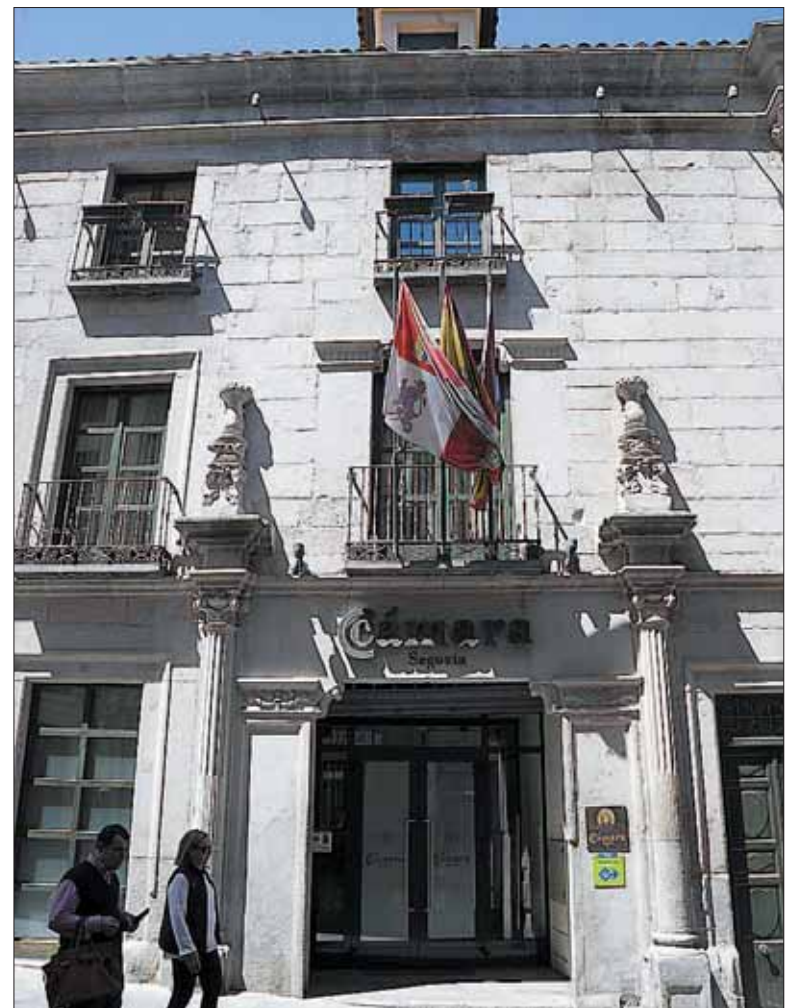
Fachada de la sede de la Cámara de Comercio.

Entre otros, puede participar en conflictos entre empresas, entre una sociedad y sus administradores o socios, o entre aquellos y estos, o estos últimos entre sí, distribución o representación comercial, concesión de explotaciones comerciales e industriales, arrendamientos de locales de negocio y vivienda, o servicios de profesionales, entre otras cosas.