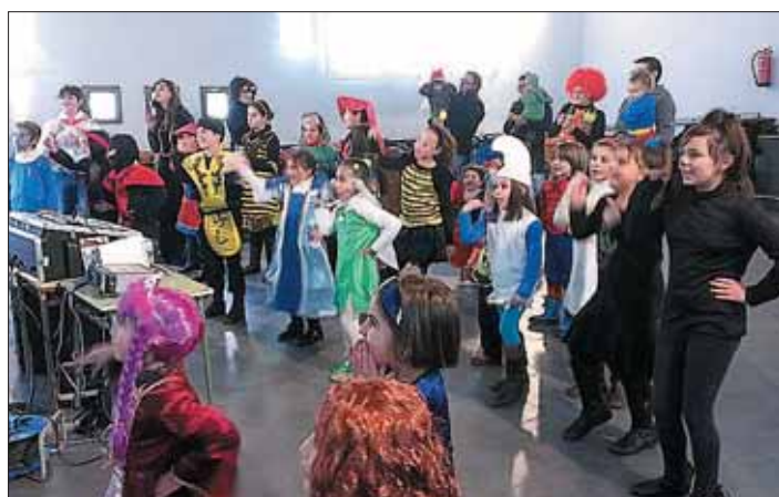
Una celebración del carnaval de años anteriores.

En otro orden de cosas, el Ayuntamiento celebrará hoy sesión de pleno, en el que se tratará entre otros asuntos la reclamación de desarrollo y ejecución de una depuradora de aguas residuales, junto a otros puntos más del orden del día.