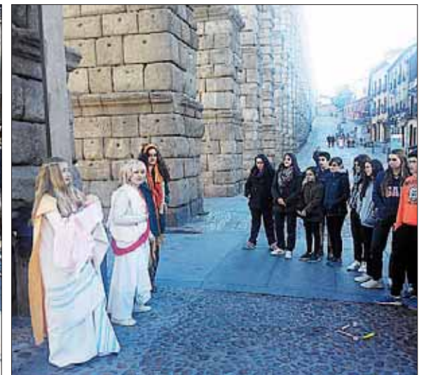
Durante la semana los alumnos han visitado museos y han hecho un recorrido teatralizado por Segovia. / EL ADELANTADO