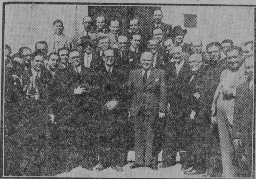
Un grupo de concurrentes al banquete con que fué obsequiado ayer en Sevilla el ministro de Agricultura.

Al arrancar el tren se vitoreó al ministro, á la República y al partido de Izquierda Republicana.