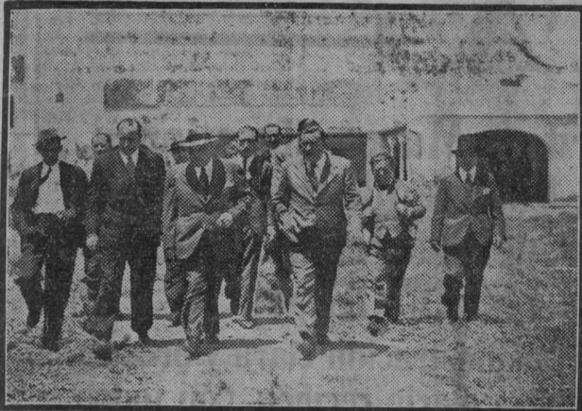
El ministro de Agricultura, señor Ruiz Funes, en la visita á la finca «Torre de la Pava».

El señor Ruiz Funes fué informado de que algunos de los asentados en La Rinconada han renunciado á sus tierras con el espejuelo de jornales altos y obedeciendo á una labor de zapa que se lleva á cabo por elementos interesados para poner obstáculos al éxito de la Reforma agraria