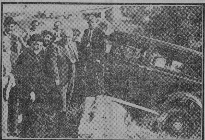
Estado en que quedó el coche que ocupaban varios ingenieros, y que se despistó en las proximidades de Al... junto al coche, el ministro informándose del accidente.