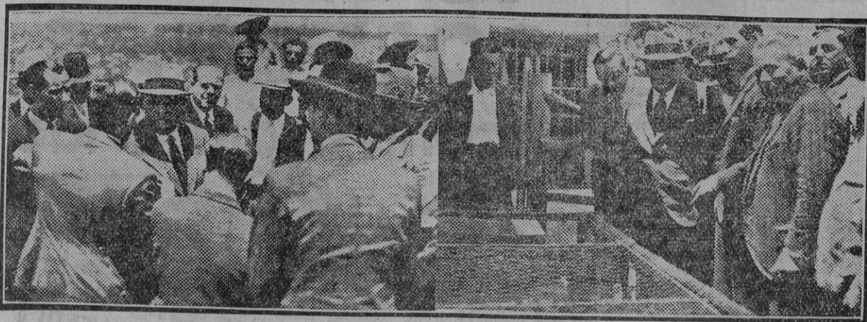
El ministro de Agricultura informándose, en presencia de los obreros, de los trabajos que efectúan los asentados en una finca del término de Gerena. El Sr. Ruiz Funes viendo una incubadora instalada por los obreros asentados en la finca «La Pi sana», expropiada al duque de Alba.