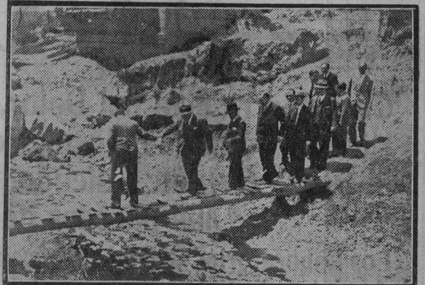
El ministro y su acompañamiento salvando el arroyo «Almonaza», cuyo puente fué destruido en las últimas inundaciones.

Pronto se verificará la inauguración del bello testimonio de acatamiento á la sabia política y á las virtudes altísimas del eminente pensador, gloria del hispano republicanismo.