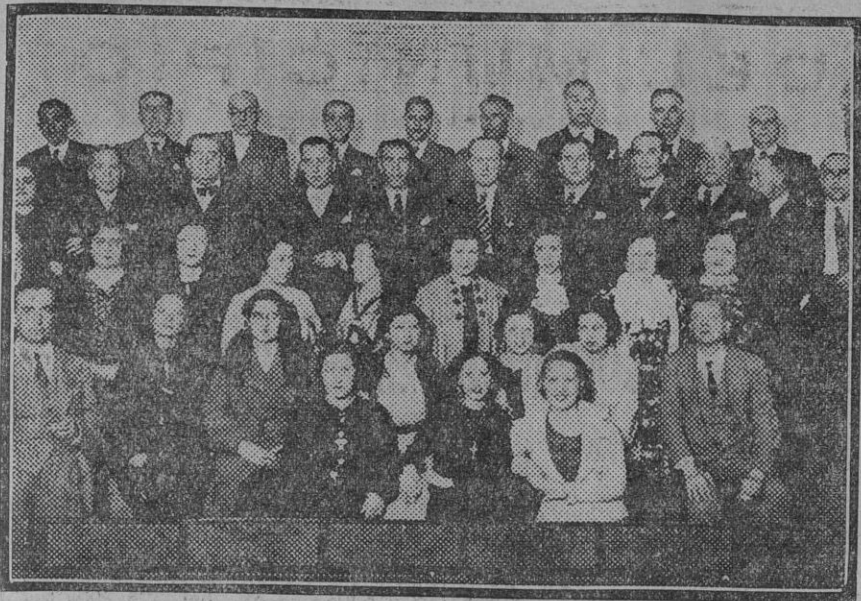
Grupo de empleados de Teléfonos concurrentes á la asamblea celebrada por el Montepío de los mismos.