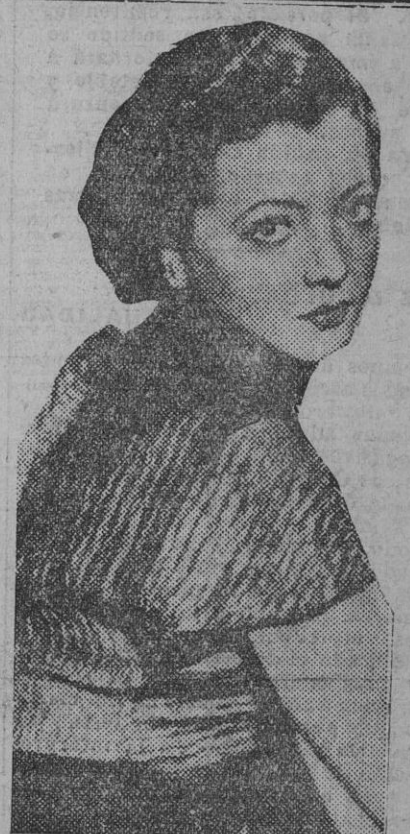
Los bellos rostros del cine.—Sylvia Sidney.

mente con las máximas colaboraciones, para que pueda emprenderse (Continúa en la página siguiente)