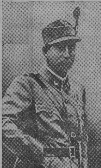
El príncipe Starhemberg, que ha sido desposeído de su cargo de vicescanciller austriaco como consecuencia de sus inclinaciones ultrafascistas, que ahora le llevan «á Roma por todo».

En ciertos Centros se dice que el porvenir del partido «heimwehr» depende de la conversación que el príncipe tendrá, á no dudar, con el jefe del Gobierno italiano.