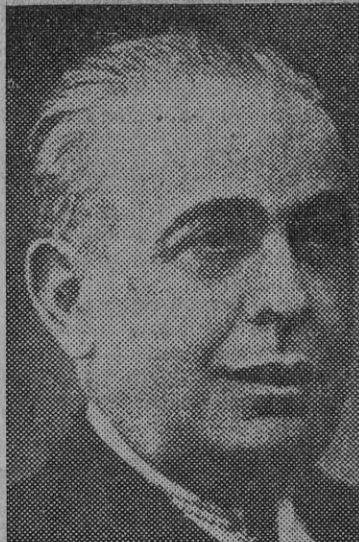
El Sr. Chapaprieta, que significa el principio de la reorganización de nuestra Hacienda pública

—Para evitarles á ustedes las molestias consiguientes, las gestiones que tenía pendientes las he hecho por teléfono desde la cámara pre-