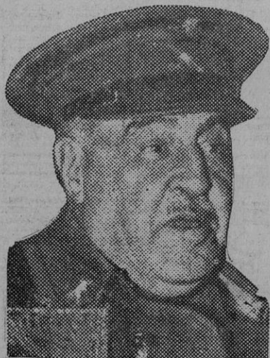
El general Molero, designado para desempeñar la cartera de Guerra.

El señor Portela Valladares marchó desde la Presidencia al ministerio de la Gobernación para tomar