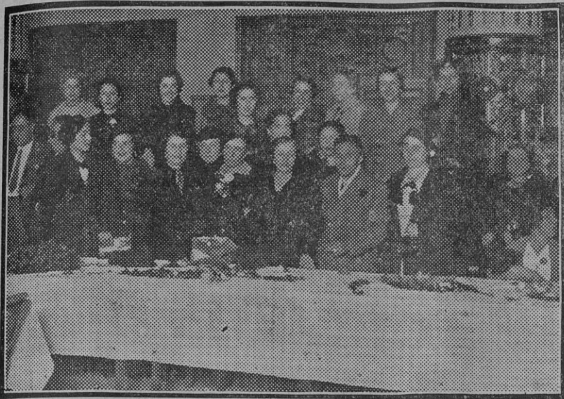
EL DIA DEL CIEGO.—Grupo de señoras y señoritas en la presidencia del banquete celebrado en el día de ayer.