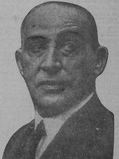
El jefe del partido agrario, que continuará regentando el hoy difícil ministerio de Estado

El ministro dimisionario recordó que no hace mucho le dió posesión de la cartera el señor Portela y su labor en el ministerio no ha sido más que seguir la huella que el se-