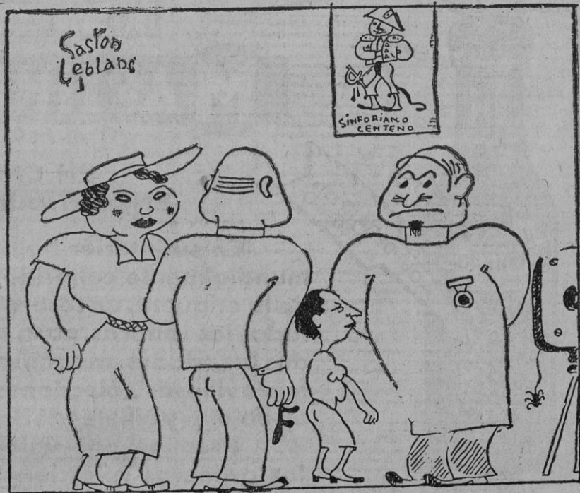
EN CASA DEL FOTOGRAFO

¿Cuándo se enriquecerá la savia del corazón para que sea verdaderamente delito inédito la deserción de la guerra y los perpetradores de ese delito, blancos ó negros, no tengan que apelar al juicio de las armas?