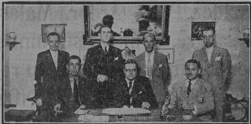
La Directiva del Centro Cultural y Humorístico de San Marcos.

¡Plaza de San Marcos! Chiquita, riente, bullidora, de irregular trazado, puede decirse que es como el pulmón de la barriada su Casino y hasta su propia alma.