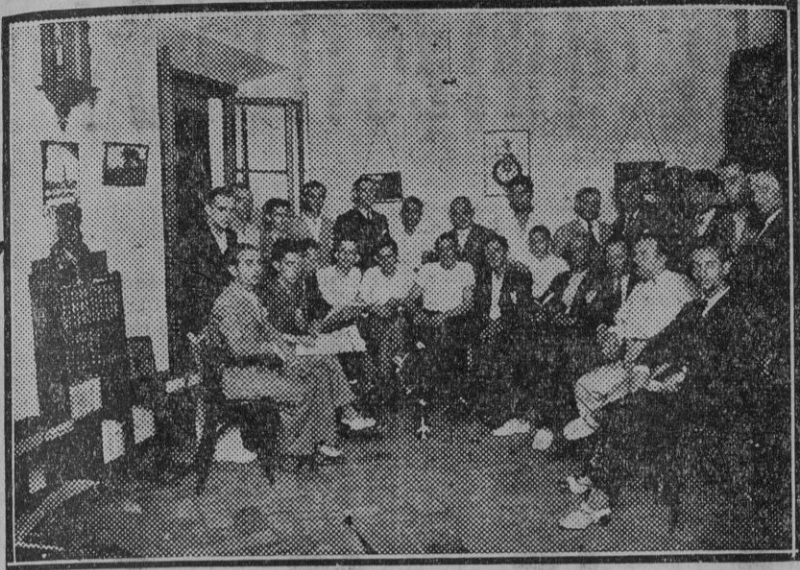
Uno de los salones del Centro.