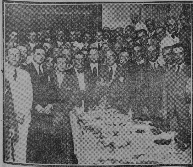
Acto inaugural del nuevo Centro de barrio Peña de la Puerta de Triana, con asistencia del elemento oficial.

Con aportaciones de los socios amueblaron con sencillez, pero muy decorosamente, los dos salones de que disponen, y se administran tan escrupulosamente que en los cinco meses que llevan de funcionamiento tienen saldadas todas sus deudas. Disponen de una pequeña biblioteca que cuenta ya con 120 volúmenes y que en breve pasará de los 200.