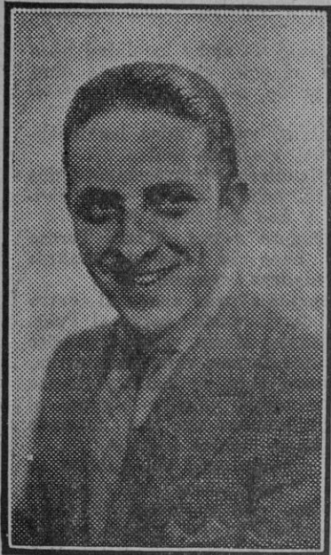
Roberto Rey, el popular cantante cinematográfico, que deleitará al público sevillano en el teatro San Fernando el viernes 7 con varias canciones de su escogido repertorio.