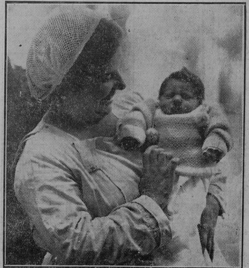
La niña encontrada anoche en la calle Mariano de Cavia, en brazos de una «nurse» de la Casa Ouna.

Según el «Times», sir John Simon, responderá por el Gobierno á la interpelación. Es posible que el Gobierno inglés no haya recibido aún pasado mañana las explicaciones solicitadas sobre el discurso de Hitler.