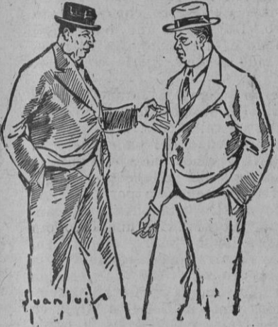
El dibujante «se acuesta a las ocho»; pero antes ha visto este apunte.

—No, señor, no lo encuentro. Le he propuesto el negocio a varios amigos y todos me contestan con una broma: «Que er puesto va a sé pa mí solo». «Que er puchero lo voy a poné yo.» ¡Ya sabe usted como las gastan por aquí los amigos! —¿Y mientras eso llega? —Pues mientras eso llega, aquí me tiene usted de comisionista en juergas, que es una de las cosas más difíciles del mundo. —¿Y eso qué es? —De más lo sabe usted! Meterse en juerga es cosa fácil. Buscarla, procurarla, hacerla, crearla, es difícilísimo, a veces imposible. Y, sin embargo, como hay que visitar a diario a esa señora que se llama doña Encarnación, la mujer más interesada del mundo, la que no habla si no se le da dinero, tiene uno que salir un día y otro, una noche y otra, con frío, con lluvia, con buen tiempo, con mala ó buena cara, para enterarse quién llegó, a qué vino, por qué está aquí, quién lo acompaña y si la cosa está a tono para que se deje escuchar una guitarra y se cante una copla por siguiurias. ¡Eso es mucho más difícil que vender un puchero en seis perras gordas... y se hace!... —¿Hay cada día menos afición al canté?