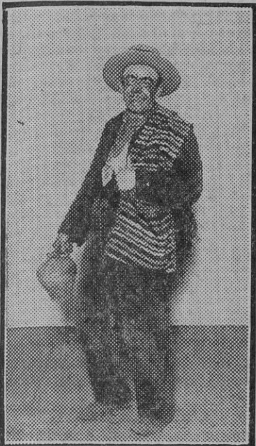
—¡A la Argaba me voy!...