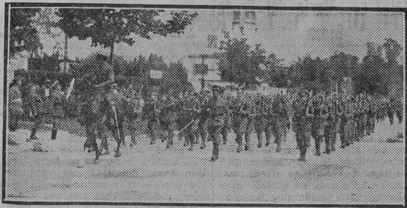
La Infantería desfila ante el general señor Villa-Abrille. (Fdo. Gori.)