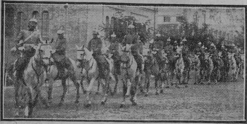
Fuerzas de Caballería desfilando ante el general de la División con los nuevos uniformes que lucirán en su próxima visita á Gibraltar.