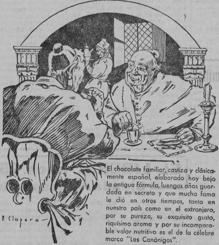
«Una jícara de chocolate «Los Canónigos» es otra de las delicias de España».

«PANCRELINE». Único específico científico que recomiendan señores Médicos para la desaparición total de la Glucosa. Remitimos gratis tratado y cura Diabetes. Laborts. «UDA». Sec. «Pancreline». Copons. 7 - Barcelona En Sevilla: Angel Ferrés. Plaza Encarnación, 34.