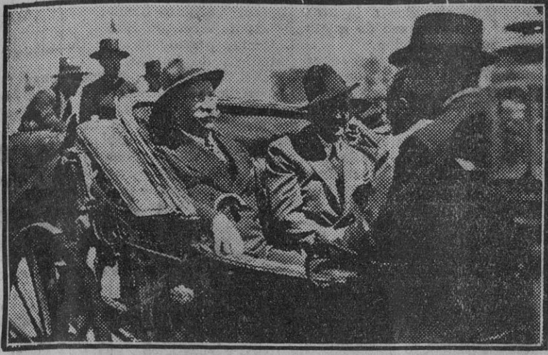
El presidente del Consejo de ministros paseando por la Feria en un coche enjaezado á la andaluza.

Conversando con los periodistas, el señor Lerroux expuso los propósitos que le animan para aliviar esta situación, y brevemente rozó el tema político