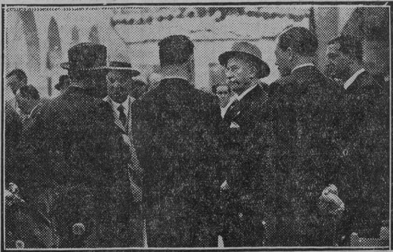
El señor Lerroux es obsequiado á su llegada á la caseta del partido radical por la juventud del partido.

A las once de la mañana empieza el repórter á cumplir con su obligación en la Feria.