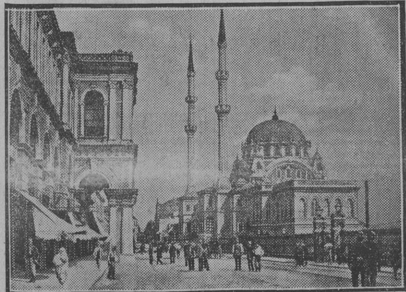
PANORAMAS EXTRANJEROS.— Stambul: Mezquita y quiosco imperial en Top-Hané.