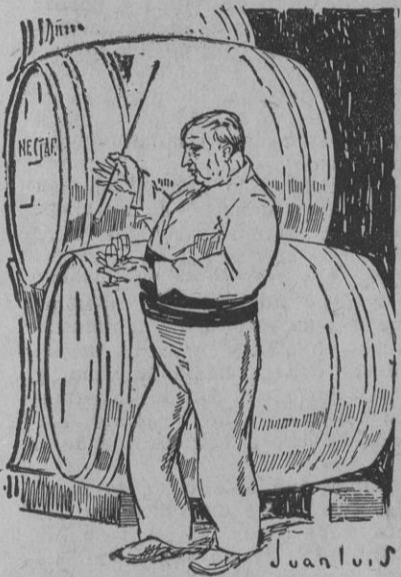
El valiente domador, en su otro aspecto, de oficiante el Baco.

Allí, en aquel no muy amplio salón, cumple su cometido con el ceremonial de un rito, un hombre que ya pasó de la cincuentena, bajito, rechonecho, coloradote, con ese color