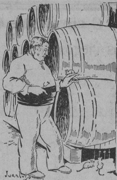
El amigo Cos: tomando la «locón» de acrobacia a una de sus «terricillas» fiercillas.

El escanciador de la bodega nos ha obsequiado con la sexta venencia