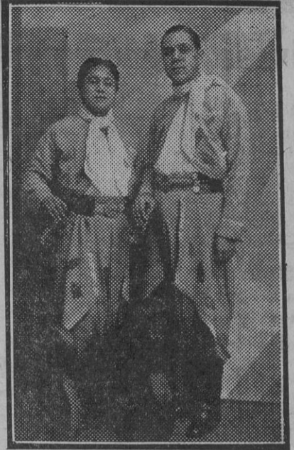
Los Cayanos estibados argentinos que han actuado con gran éxito, en Sevilla.