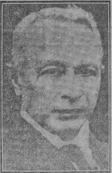
Hugo Junkers.— Profesor fallecido en Berlín á los 76 años de edad, muy conocido como constructor de los aviones de su nombre.

Las últimas noticias acusan una agravación en el conflicto italo-abisinio. Italia prepara sus poderosos medios guerreros. Acaso sea muy posible que una obstinación de Etiopía origine una guerra, lo mismo que ocurrió con Inglaterra en tiempos de la reina Victoria. Entonces, un cuerpo de ejército, al mando del general Napier de Magdala, entró en Abisinia y venció al Negus Teodoro, el cual se suicidó.