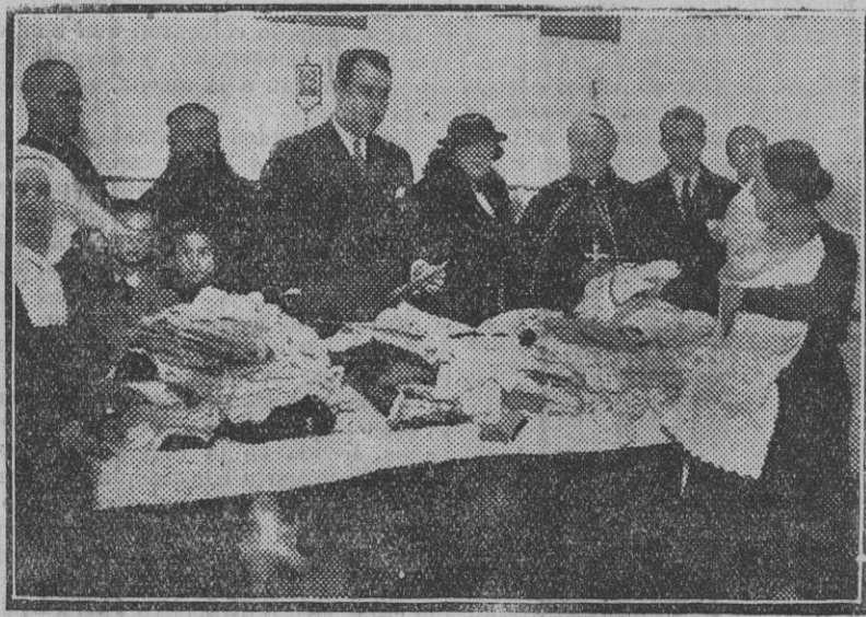
Reparto de ropa a los niños acogidos en el Consutorio de Los Amigos del Niño, en San Cayetano.