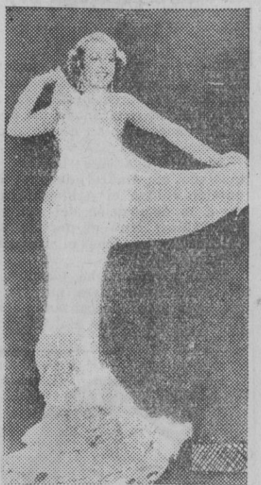
Frances Drake, desusada estrella del cine