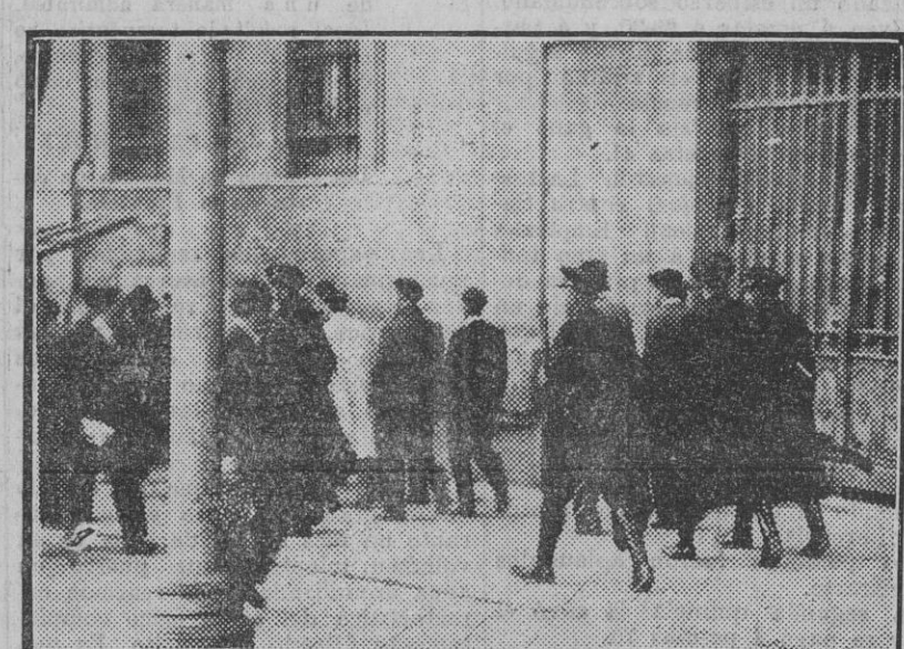
MADRID.—Los guardias de Asalto conduciendo á un grupo de estudiantes detenidos con motivo de los sucesos de la Facultad de S. Carlos. (Fot. Díaz Casariego.) (Edo. Gori.)

«Thé dansants». — Domingo 11. — Hotel Cristina.