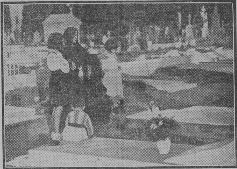
¡Vaya un cuadro...!