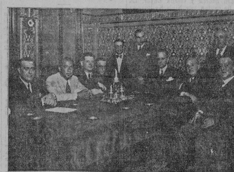
El nuevo Consejo de administración del Monte de Piedad

París 27.—Con objeto de intensificar la campaña gubernamental contra el elevado coste de la vida, el ministro del Interior, M. Albert Sarraut, ha mandado una nueva circular a los prefectos para que ejerzan la vigilancia debida, confirmando instrucciones dadas anteriormente. Expone el ministro las iniciativas, realizadas con éxito en algunos departamentos, tales como la colocación de carteles anunciando los precios al por mayor a la entrada de los mercados, para que se puedan vigilar fácilmente los precios al por menor. Se han adoptado medidas contra los vendedores que pretendían obtener beneficios demasiado elevados.