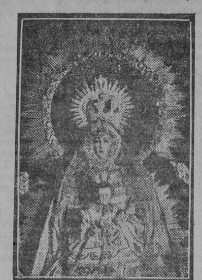
Nuestra Señora del Águila, patrona de Alcalá de Guadaíra

Tarea un poco infantil sería pretender que por el motivo de un programa de festejos más ó menos amplio los pueblos circunvecinos y sobre todo Sevilla se volcaran (como ahora se dice), haciendo acto de presencia en nuestro pueblo con motivo de sus fiestas, no. Alcalá, por sus propios méritos y por sus bellezas naturales, es el pueblo por