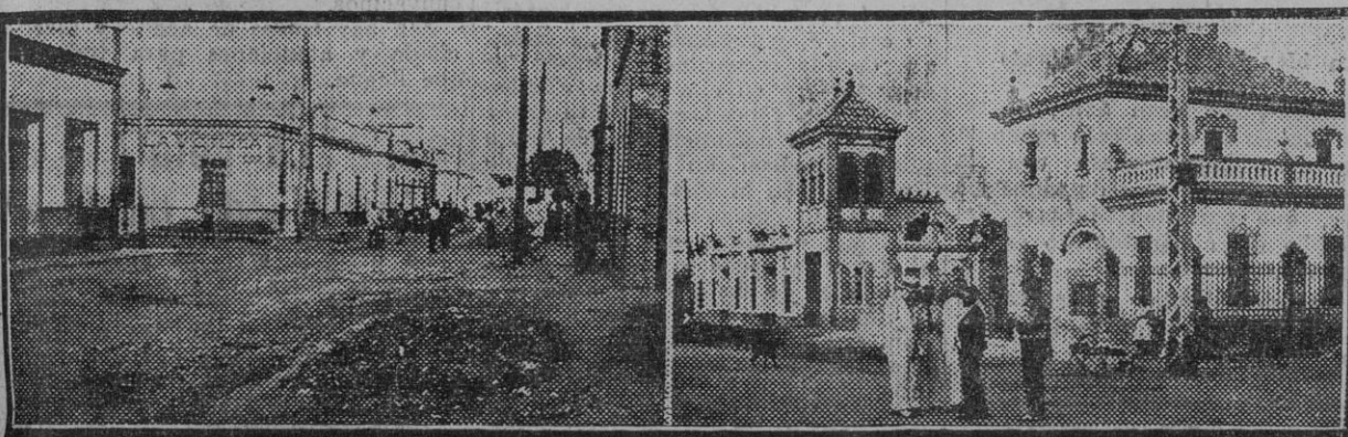
Dos aspectos de la barriada

SEIS MIL PERSONAS VIVIENDO ENTRE EL POLVO EN VERANO Y ANEGADOS DE FANGO EN INVIERNO