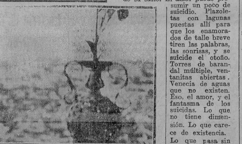
la Giralda, cementerio enorme, y se dejaba tragar por la nube maravillosa que vemos.