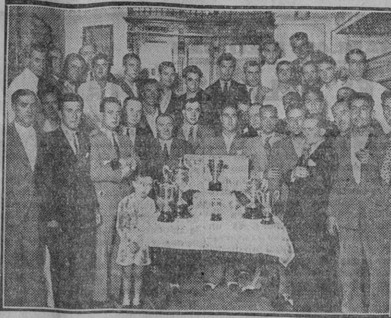
De la carrera de motos gran premio de Andalucía. Entrega de los premios a los ganadores

Ya no hubo goles hasta los 40 minutos en que Vilanova obtuvo el empate, desempañando dos minutos