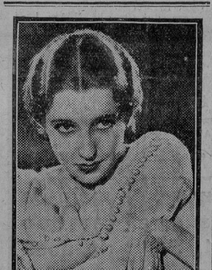
Mona Barrie, nueva actriz del cine americano.