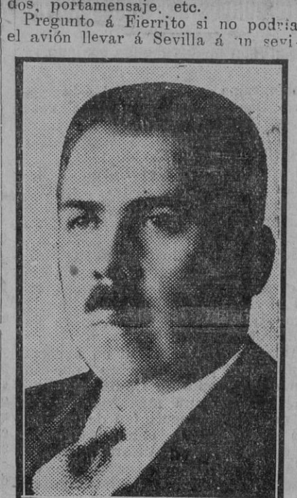
El general de división Lázaro Gardénas, futuro Presidente de Méjico para el período de 1934 a 1940, que tomará posesión el día 1 de Diciembre de 1934.