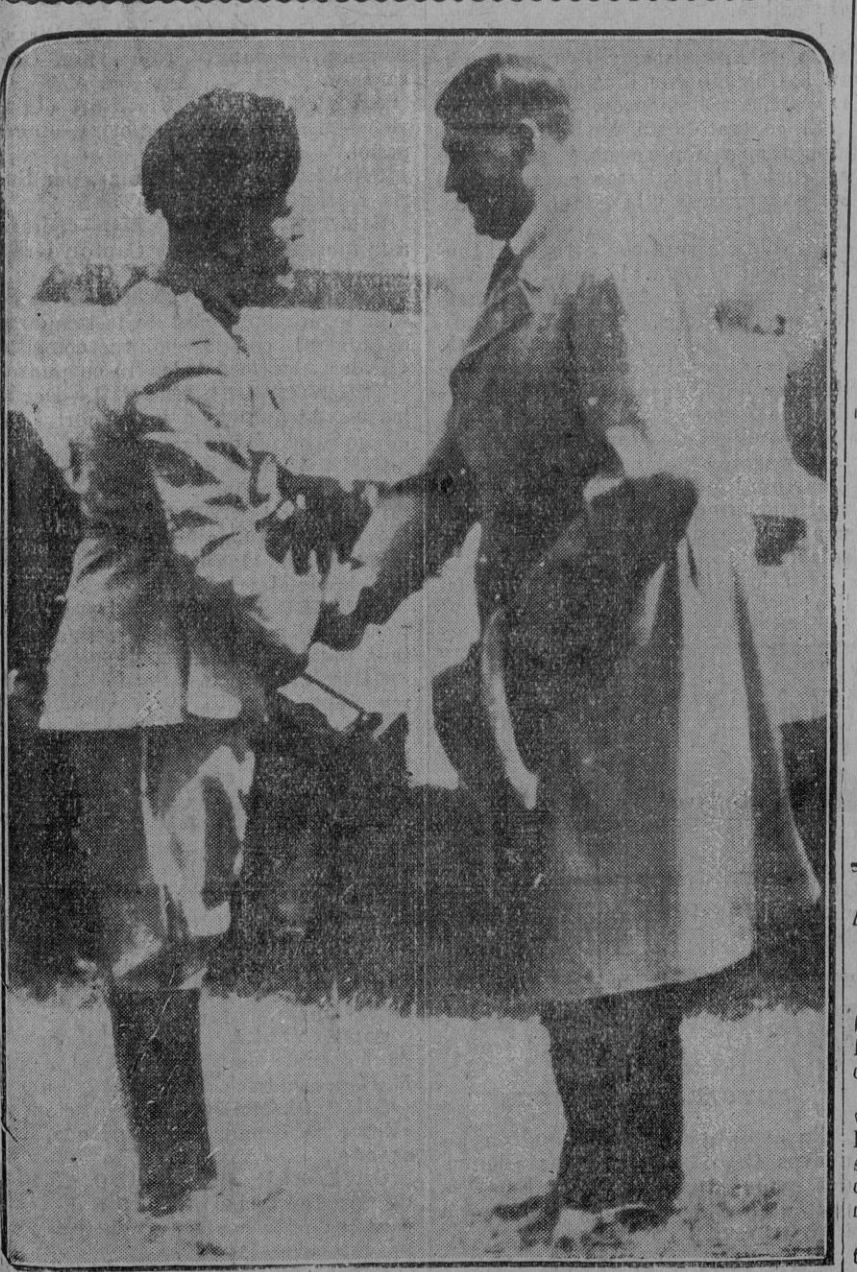
Ya es conocida por las referencias telefónicas la entrevista que en Venecia han celebrado Mussolini é Hitler. De dicha entrevista es la presente fotografía, que registra la entrevista que ya muchos califican de histórica.

Lo curioso del caso es que interrogado acerca del destino que proyectaba dar a los diez duros, contestó que los quería para gastarlos, pero no sabía en qué.