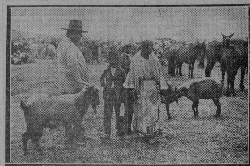
El ganado debe estar en campo abierto...

El ganado : Hay que pensar en otro emplazamiento para el ganado. Los ganaderos se quejaban este año de no poder instalar el ganado con la comodidad debida. El ganado necesita estar, según los técnicos, en campo abierto para que