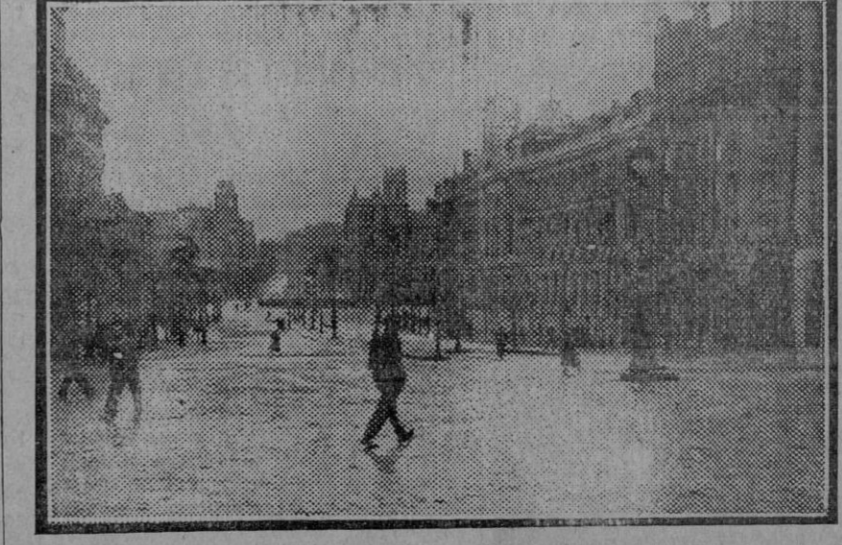
MADRID.—Un aspecto de la famosa calle de Alcalá durante uno de los días de huelga general. (Foto Díaz Casariego.)

La suscripción Pesetas Sumá anterior... 4.938,00 Don M. A. .... 62,00 Total..... 5.000,00