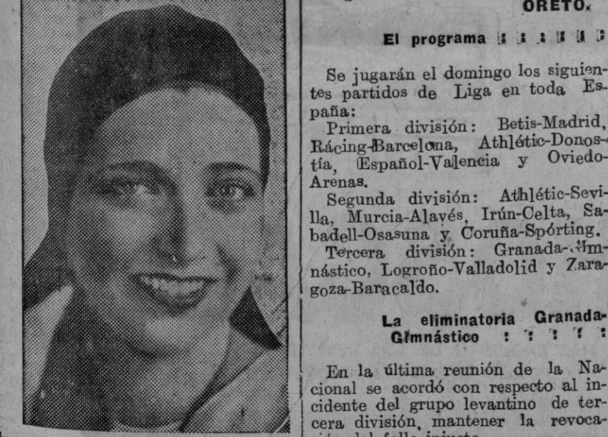
Kay Francis, una de las actrices que imponen la moda en Hollywood.