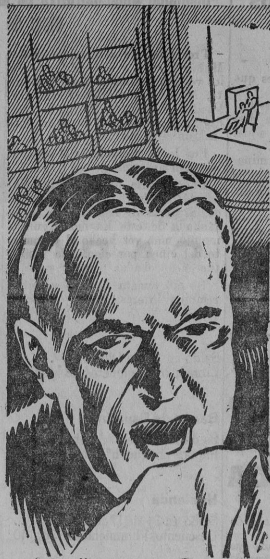
Ni os ni cafarros.

Pasados unos días, pueden ser recogidos en las oficinas de la L. A. P. E., Avenida de la Libertad 47, los trabajos presentados en Sevilla.