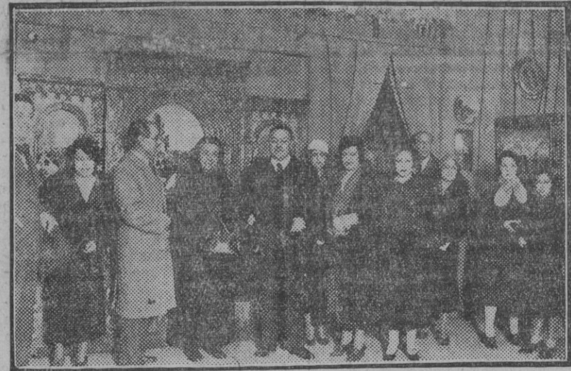
MADRID.—Inauguración de la exposición de cerámica Tuloaga, con asistencia del Presidente del Consejo, Excmo. Sr. D. Diego Martínez Barrio.