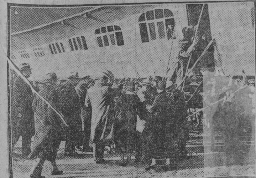
Los viajeros subiendo a la barquilla