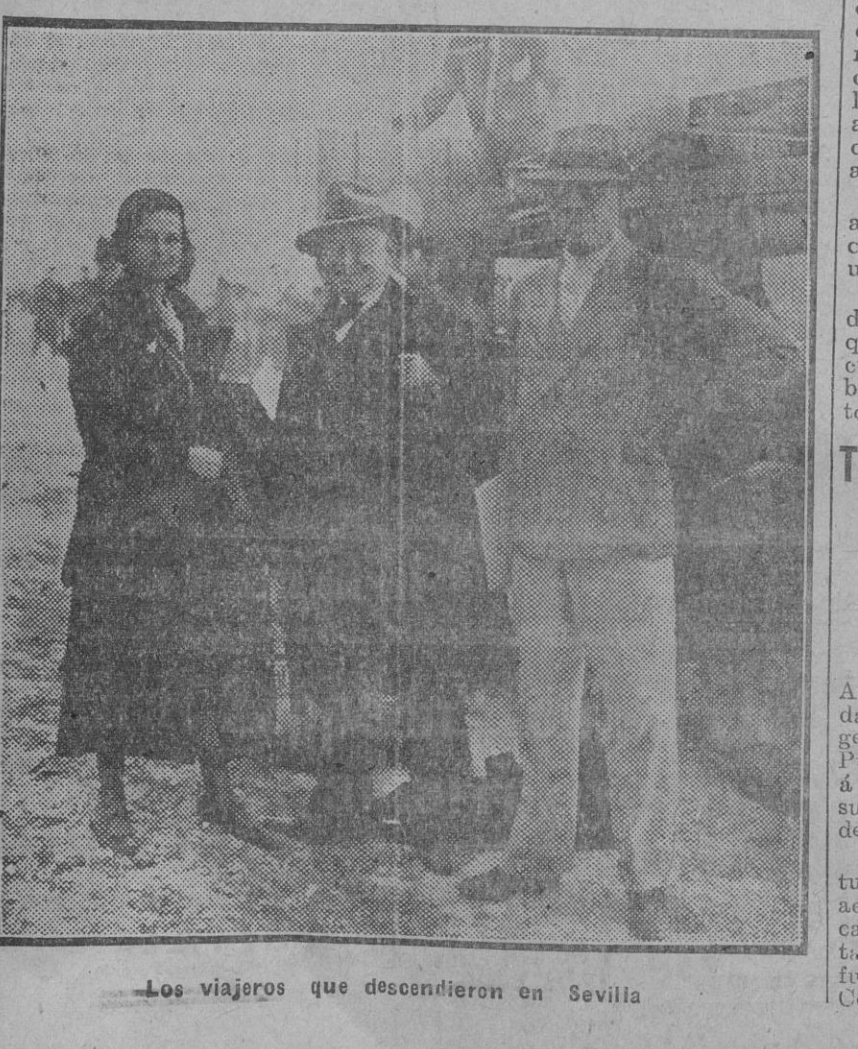
Los viajeros que descendieron en Sevilla