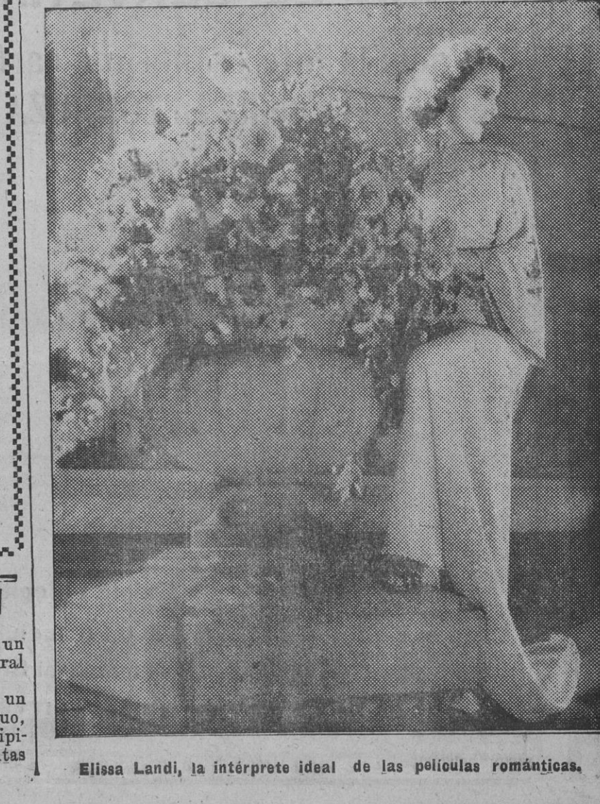
Elissa Landi, la intérprete ideal de las películas románticas.

Los informes sanitarios llegados de las zonas afectadas por la epidemia dan detalles aterradores de la importancia extraordinaria de la misma.