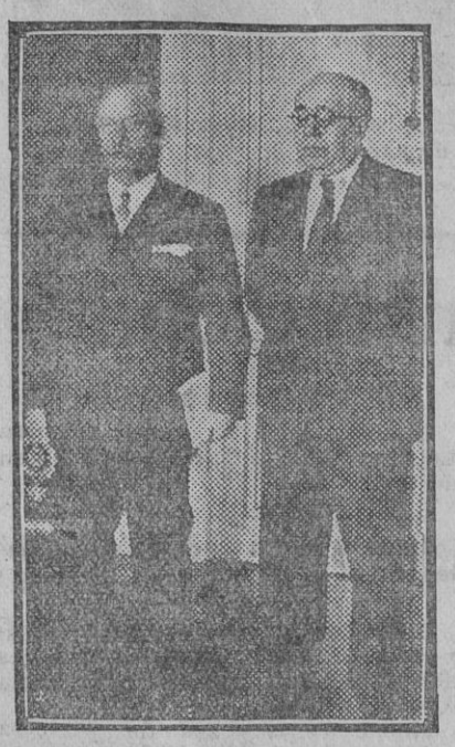
Los señores Lerroux y después de la toma de posesión del primero.

Madrid 13.—A las dos de la tarde terminó la reunión del Consejo de ministros en el Palacio Nacional, bajo la presidencia del señor Alcalá Zamora.