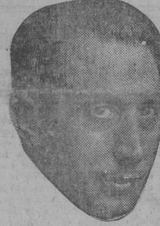
El doctor del Campo, por la Universidad.

Necesitamos ver en el orden del día de las Cortes Constituyentes un dictamen de franca colaboración con estas angustias nuestras; que una