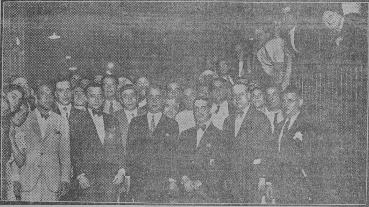
Momento de partir el alcalde con los representantes de las fuerzas vivas para solicitar del Gobierno auxilios económicos para Sevilla

Según adelantamos oportunamente, anoche, en el expreso, salió para Madrid la representación de las fuerzas vivas de Sevilla que va a parlamentar con el Gobierno de la República para tratar de solucionar el grave problema de nuestra ciudad. La despedida que se le tributó a los expedicionarios ha constituido una demostración contundente de hasta qué punto ha sabido el pueblo sevillano comprender el alcance de este intento, decisivo para el porvenir de Sevilla. El público ocupó totalmente los andenes de la plaza de Armas desde mucho antes de la hora de la partida del expreso y vitoreó a los diversos representantes a medida que iban llegando. A la estación acudieron el gobernador civil, señor Alonso Mallol; el jefe de la División militar, general Núñez de Prado; el primer teniente de alcalde, señor Sánchez Suárez; diputados provinciales y todos los