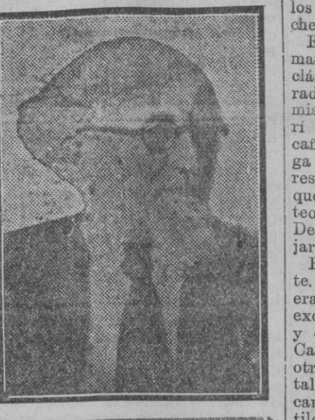
SABETAY I. D'JAEN CHEFRABIN DU CULTE ISRAËLITE ESPAGNOL DE RUMANIE

Procedente de Córdoba llegó ayer a Sevilla el gran rabino del culto israelita español en Rumania. Sabetay I. D'Jaen, como reza su tarjeta, es un hombre de unos setenta años, que habla el castellano correctísimamente y que, a poco de saludar al reportero, se deshace en elogios para España y su República.