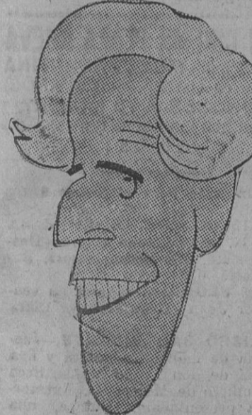
No existe el mito Besteiro

No existe el mito Besteiro. Nosotros creemos que la seriedad, en política, no es nunca un mito. Hay en las luchas de los partidos hombres vehementes, hombres fríos y hombres simplemente serios.