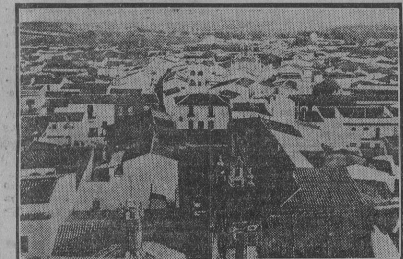
La Palma, capitalidad del Condado, por donde se han iniciado las Rutas de EL LIBERAL en la provincia de Huelva.

En el caso de Sevilla, como en tantos otros, no importa a los aciertos de los fracasos pasados. Hay que atenerse a las actividades presentes. Un diputado por Sevilla, cuyo nombre sonará en su día, porque ahora lo interesante es que los buenos éxitos los obtengan la colectividad representativa y el pueblo mismo, celebró ayer una extensa conferencia con el señor Azaña, noticia que no han publicado los periódicos y que nosotros conocemos sólo por conducto particular.