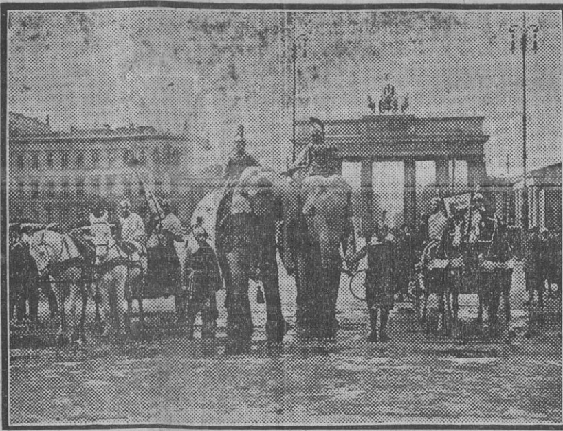
BERLIN.—Elefantes en la Puerta de Brandenburg en el momento en que se disponía la filmación de una película (Edo. Gori.)

Varios vecinos de la calle nos han dicho que no les extrañó la presencia de aquellos hombres en la acera de la oficina, pues los sábados á esa hora se suelen reunir allí veinte ó veinticinco obreros accidentados para cobrar sus jornales.