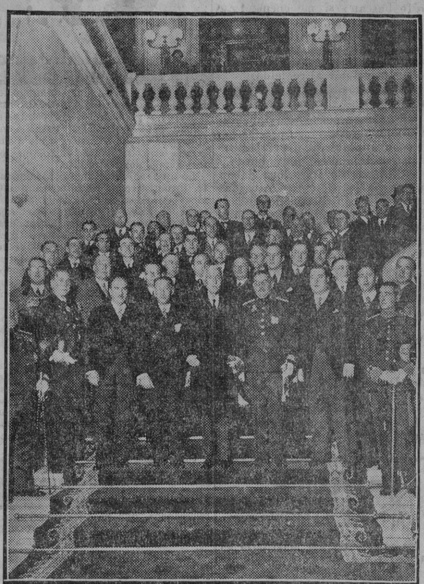
Apertura del Parlamento Catalán, el señor Mrciá con los diputados a la salida de la inauguración oficial del Parlamento. (Fdo. Gori.)

Según parece, el bandido Flores se ha internado en la parte más abrupta de la sierra y ha afirmado que antes de entregarse se matará.