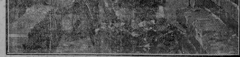
Efectos causados por el petardo que explotó en la chimenea de la fábrica de ladrillos de los Remeños. (Fdo. Gori.)

Bien, amigo Paunero. A los aplausos recibidos en Bruselas una usted los que de todo corazón le enviamos sus amigos españoles y sevillanos, que sentimos como usted un gran amor por la República y gran cariño por que el nombre de Sevilla y de los sevillanos (usted ya ha adquirido ócula de vejez) vaya por todas partes poniendo alto el nombre de España.