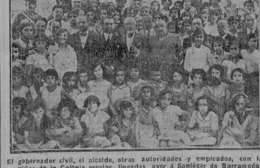
El gobernador civil, el alcalde, otras autoridades y empleados, con las niñas de la Colonia escolar, llegadas ayer a Sanlúcar de Barrameda